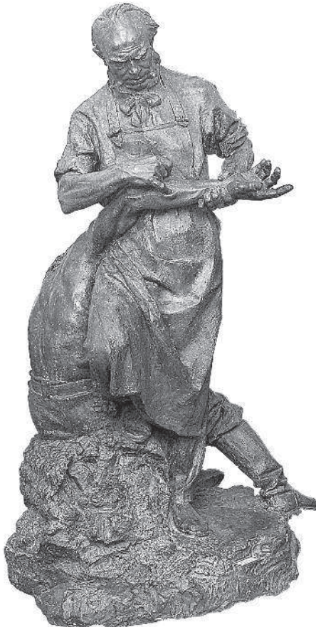
В. М. Дружин. Пирогов и матрос.

и это есть одна из главных современных, наиболее благодетельных и полезнейших иллюзий. Эта иллюзия полезна уже и тем, что направляет все наши умственные силы на предметы, подлежащие самому точному чувственному анализу и исследованию, не давая увлекаться тем, что навсегда для нас должно остаться заповедною тайною».