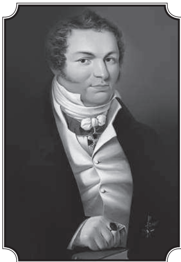
Матвей Яковлевич Мудров (1776—1831)

Один из основателей российской терапевтической школы, военной гигиены, первый директор медицинского факультета Московского университета.