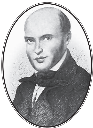
Николай Пирогов во время учебы в Московском университете.