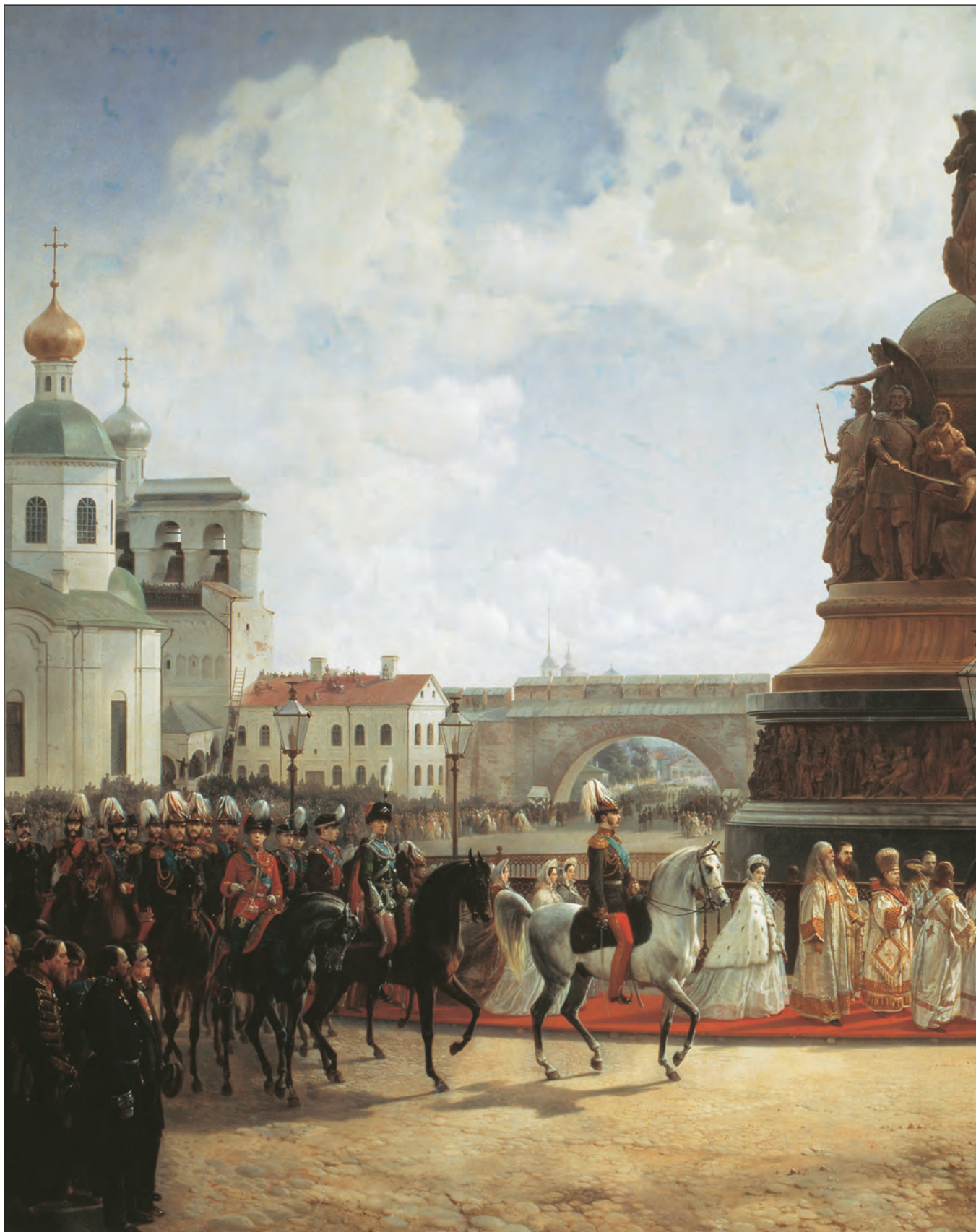
Торжественное открытие памятника «Тысячелетие России»