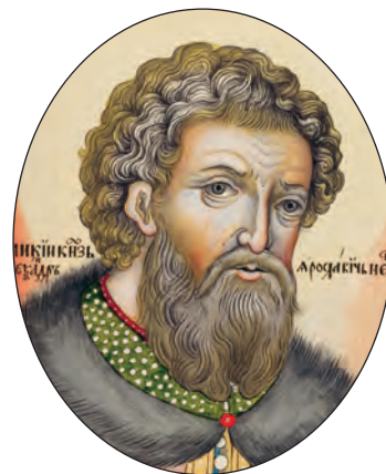
Великий князь Александр Невский

Под предводительством князя Александра Ярославича Невского новгородцы разбили шведов, которые вторглись на их земли. А потом разгромили на льду Чудского озера немецких рыцарей. Благодаря действиям Александра Невского Новгород откупился от монголов и был единственным русским городом, который не разграбили в годы ордынского владычества.