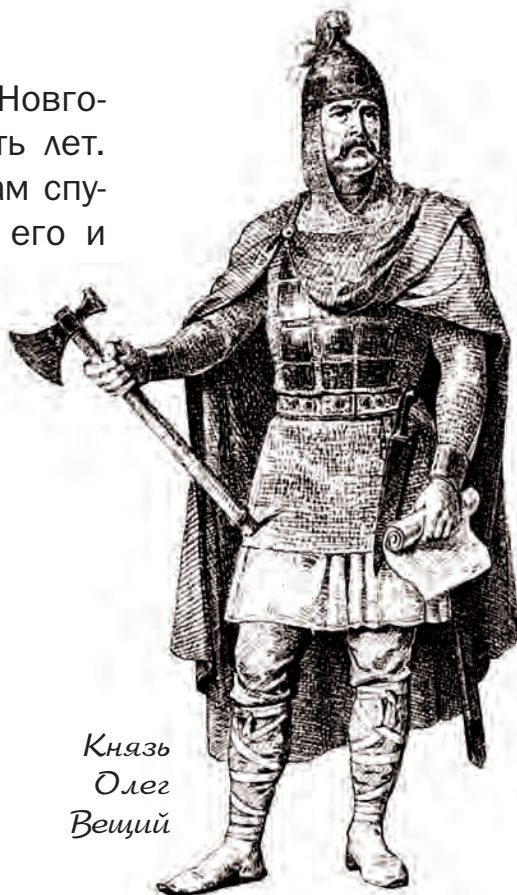
Князь Олег Вещий