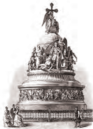
Памятник «Тысячелетие России»

Столицей Древнерусского государства Новгород оставался недолго — всего двадцать лет. В 882 году князь Олег на ладьях по рекам спустился из Новгорода к Киеву, захватил его и объявил новой столицей русских земель.