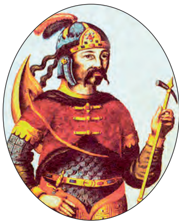
Легендарный князь Рюрик

Первой столицей Древнерусского государства стал Новгород.