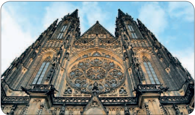
Костел Девы Марии перед Тыном