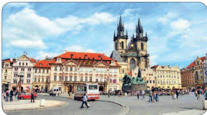
Староместская площадь, Прага