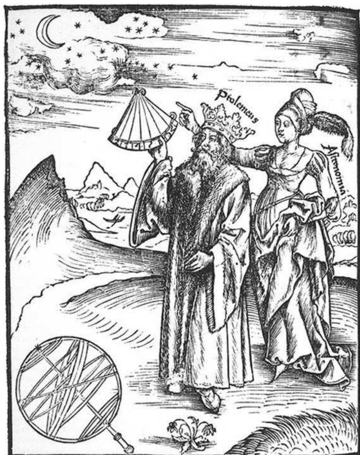
Символическое изображение Астрономии рядом с величайшим астрономом древности Клавдием Птолемеем из книги Грегора Рейша «Жемчужина философии» (1503)