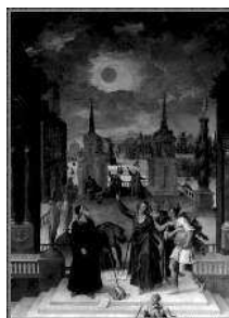
Картина А. Карона «Астрономы, изучающие затмение» (1571)

Естественно, люди не могли не заметить, что на небосводе происходят постоянные изменения: солнце движется в течение дня, луна меняет размер и положение, даже звезды не остаются на одном месте. Еще древнеегипетские жрецы, в III тысячелетии до нашей эры, занимались астрономическими наблюдениями и сделали несколько открытий. Например, они научились предсказывать ежегодный разлив Нила, заметив, что он наступает сразу