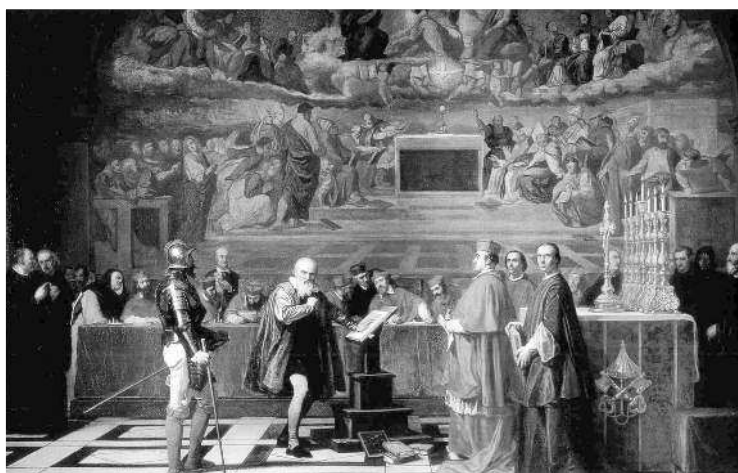
Картина Ж.-Н. Робер-Флери «Галилей перед судом инквизиции» (1847)