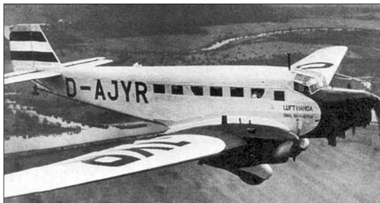
Ju 52/3m авиакомпания Lufthansa

Смена «вахты» на «капитанском мостике» «Фокке-Вульфа» совпала по времени с существенными изменениями в германской авиапромышленности. Приход к власти нацистов обусловил практически полное прекращение разработок гражданских лайнеров. Разработка машин такого назначения велась только как «побочный продукт» при создании бомбардировщиков. Пассажирские варианты самолетов Do 17, Ju 86, He 111 обладали отличными по тем временам скоростными характеристиками. Вот только вместимость их была недостаточной, а комфорт в пассажирских кабинах, организованных на месте бомбоотсеков, явно оставлял желать лучшего. Правда, в распоряжении «Люфт-