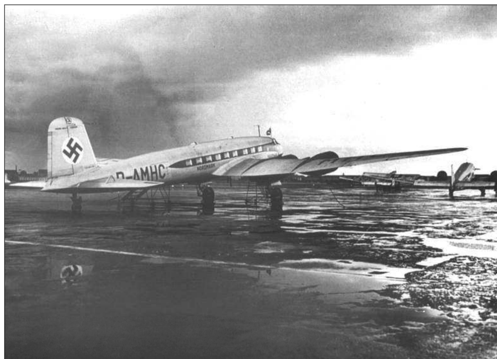
Справа: Второй прототип FW 200V2 – D-AMHC «Вестфален»