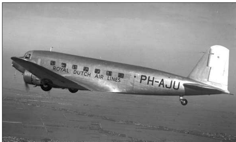
DC-2 авиакомпания KLM

Попытки «Люфтвагзы» заказать авиастроительным фирмам современный пассажирский самолет поначалу встречались с резко негативным отношением со стороны рейхсминистерства авиации, считавшим приоритетным удовлетворение нужд люфтваффе и опасавшимся, что ресурсов германской авиапромышленности попро-