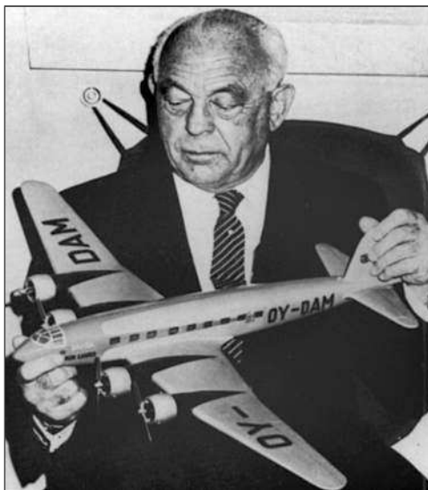
Курт Танк с моделью FW 200Ка-1. Фотография 1970-х годов

Конкурентом «Фокке-Вульфа» был «Юнкерс», который не только располагал огромнейшим опытом в цельнометаллическом пассажирском авиастроении, но и имел уже готовый четырехмоторный самолет – бомбардировщик Ju 89V1, создаваемый по программе т.н. «Урал-бомбера», но так и не пошедший в серию. Прототип пассажирского самолета Ju 90V1 переделывался из Ju 89V1 – даже заводской номер у самолета остался прежним. Но рейхсминистерство авиации считало, что новую машину должен строить именно «Фокке-Вульф», поскольку бременская фирма располагала свободными производственными мощностями, а «Юнкерс» был полностью загружен выпуском бомбардировщиков. Такая позиция вызвала вполне обоснованные опасения у заказчика – «Люфтганзы», считавшей, что «Фокке-Вульф», ранее занимавшаяся только легкими самолетами, вряд ли сможет справиться с поставленной задачей. Высокопоставленные представители менеджмента авиакомпания пытались заинтересовать созданием четырехмоторного пассажирского лайнера фирму «Дорнье», у которой имелся свой вариант «Урал-бомбера» – Do 19. Однако руководство «Дорнье» отказалось – оно предпочло сосредоточиться на военных заказах, практически уйдя с гражданского рынка. Так