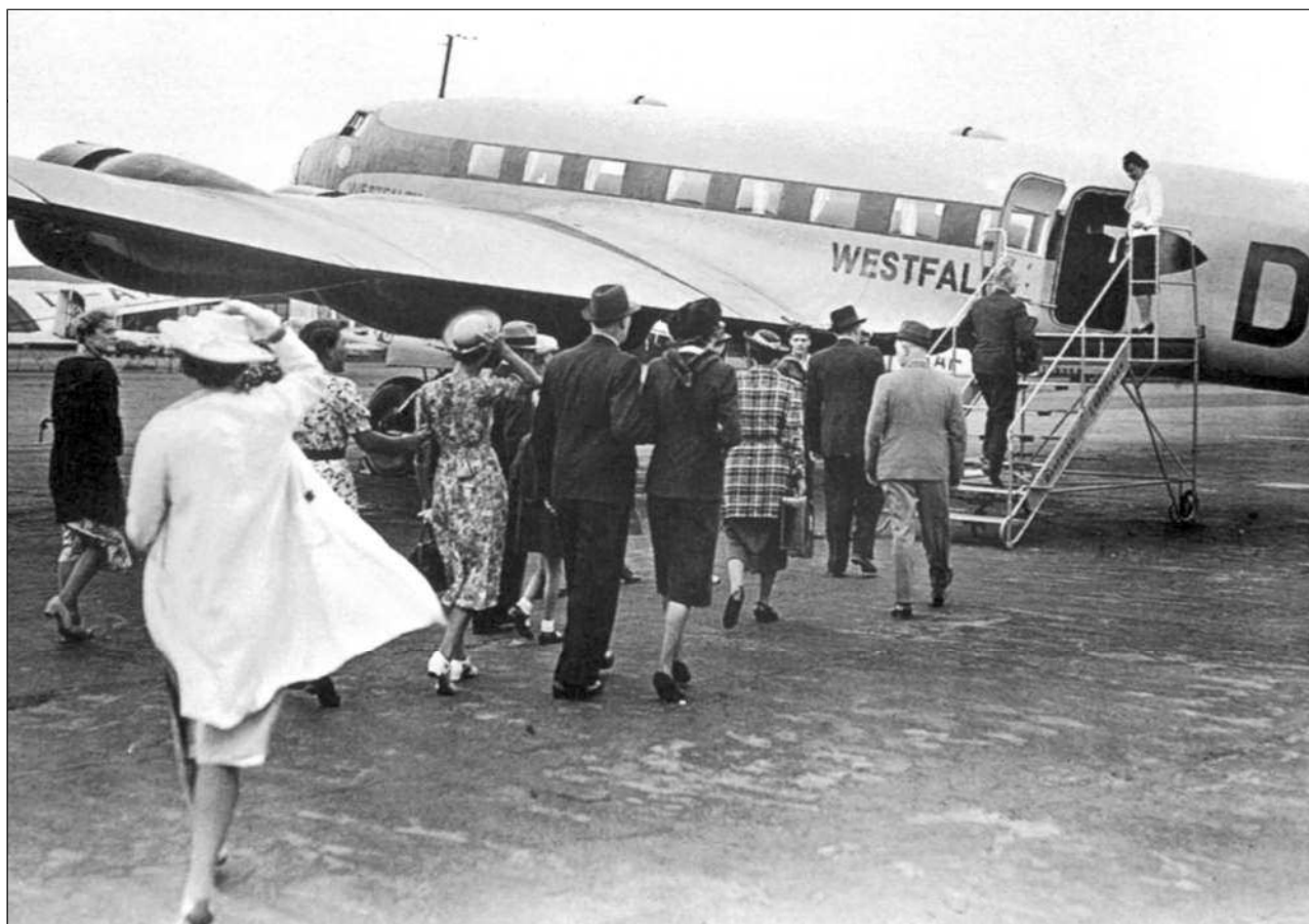
Внизу: Посадка пассажи- ров в FW 200V2, Франкфурт