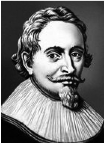
Гуго Гроций или Гуго де Гроот (1583–1645)

Голландский юрист, социолог и государственный деятель. Один из основателей теории естественного права и науки международного права. Основные труды: «О свободном море», «О праве войны и мира».