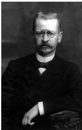
Лев Иосифович Петражицкий (1867–1931)