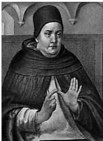
Фома Аквинский (Фома Аквинат или Томас Аквинат) (1225 или 1226—1274)

Немецкий юрист, профессор Берлинского университета (1810—1842), прусский министр по реформе законодательства (1842—1848). Известность получил как автор многочисленных трудов по римскому и гражданскому праву, как глава исторической школы права. Основной труд: «О призвании нашего времени к законодательству и правведению».