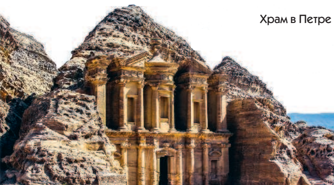
Храм в Петре