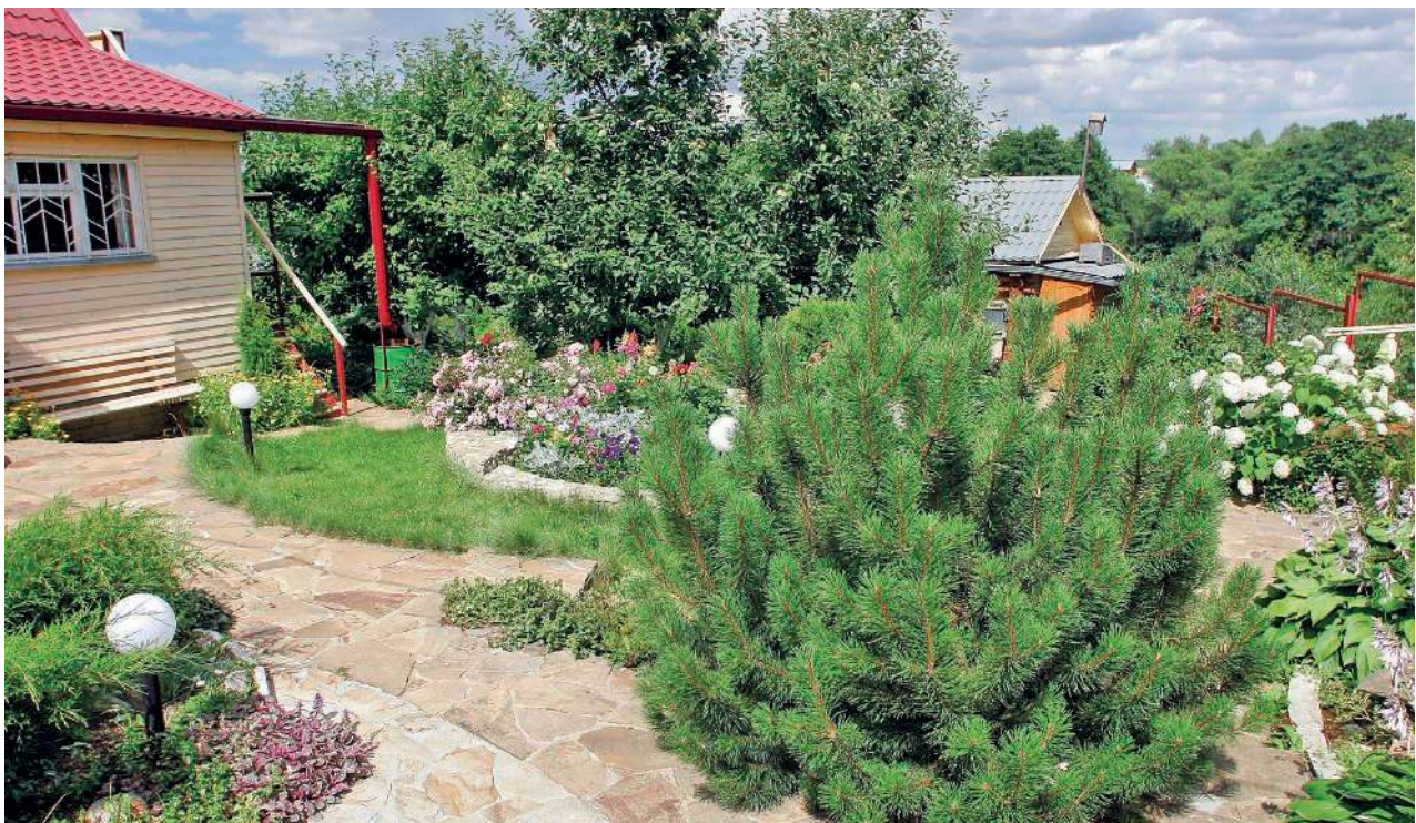
Напротив входной двери — место Малинового феникса, который приносит вам счастливые возможности.