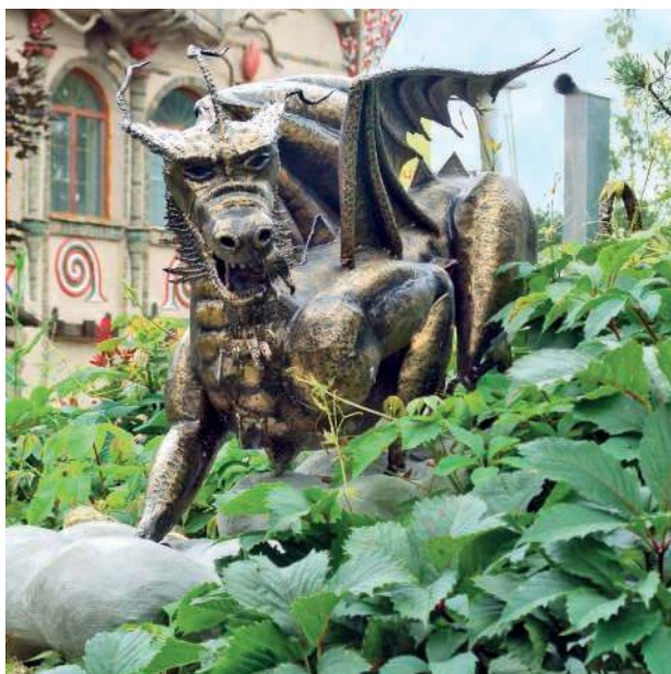
В Китае говорят: «На ровном месте дракон не совет себе гнезда».

Учитывая все перечисленное, вы, наверное, уже догадались, что лучший ландшафт с точки зрения фэн-шуй — это сложный рельеф! Именно такое пространство привлекает к себе максимальное количество Ци и дает возможность ей двигаться, извиваясь при этом. Учителя фэн-шуй говорили: «Дракон на ровном месте не совет себе гнезда». И это прекрасно согласуется с современным ландшафтным дизайном, где, как известно, самый красивый сад может быть только на рельефе с перепадами. Чем больше объектов раз-