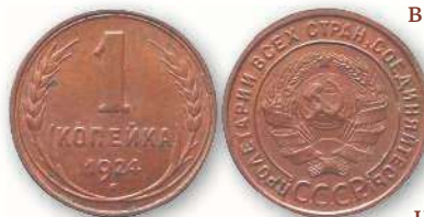
Медная копейка СССР образца 1924 г.

висит от особенностей экземпляра. Самые дорогостоящие разменные монеты того пери-