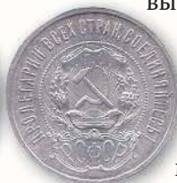
Серебряный полтинник образца 1921 г.

задач, поставленных перед Наркомфином, была в том числе и подготовка денежной реформы, которая включала в себя замену старых денежных знаков. Чеканка новых монет началась в 1921 г. За этот период монетный двор в Петрограде выпустил их серии номиналом 10, 15, 20, 50 копеек и 1 рубль. Как и первый рубль РСФСР, 50 копеек чеканили из серебра 900-й пробы (для монет более мелких номиналов использовали сплав с 500-долевым содержанием этого благородного металла).