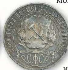
Серебряный рубль 1922 г., отчеканенный на Петроградском монетном дворе