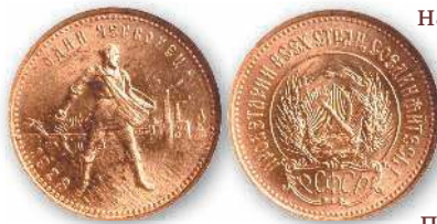
Червонец образца 1923 г.

населения оказа- лась без средств к существова- нию. Единствен- ным способом получить необхо- димый товар был