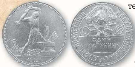
Полтинник образца 1924 г.

канке и выпуске в обращение серебряной и медной монеты советского образца». Вторым по величине серебряный номинал страны (50 копеек) стал чеканиться в РСФСР по стопе, принятой при царе. Как и в случае с червонцем Советской России, изменилось название монеты —