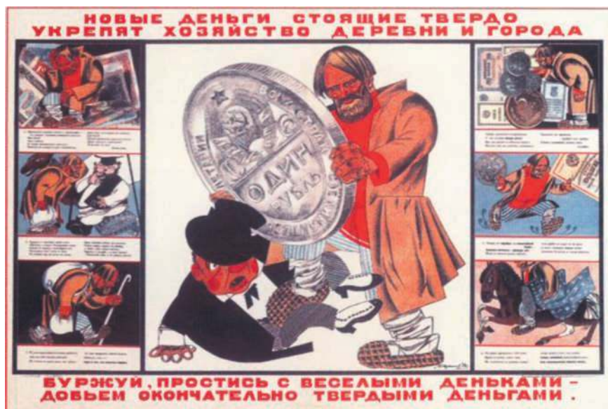
Рекламный плакат, прославляющий новые советские деньги. 1924 г.

люционные» деньги. В качестве рабочих вариантов названия монеты рассматривали «федерал», «гривну» и «целковый».