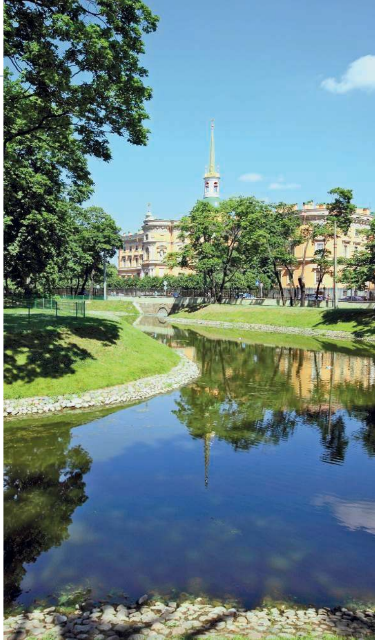
▲ У истоков Мойки

танкой. Позже реку стали называть Мья, а затем — Мойкой. Это стало следствием преобразования труднопроизносимого имени.