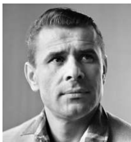
Лев Яшин Лучший вратарь XX века