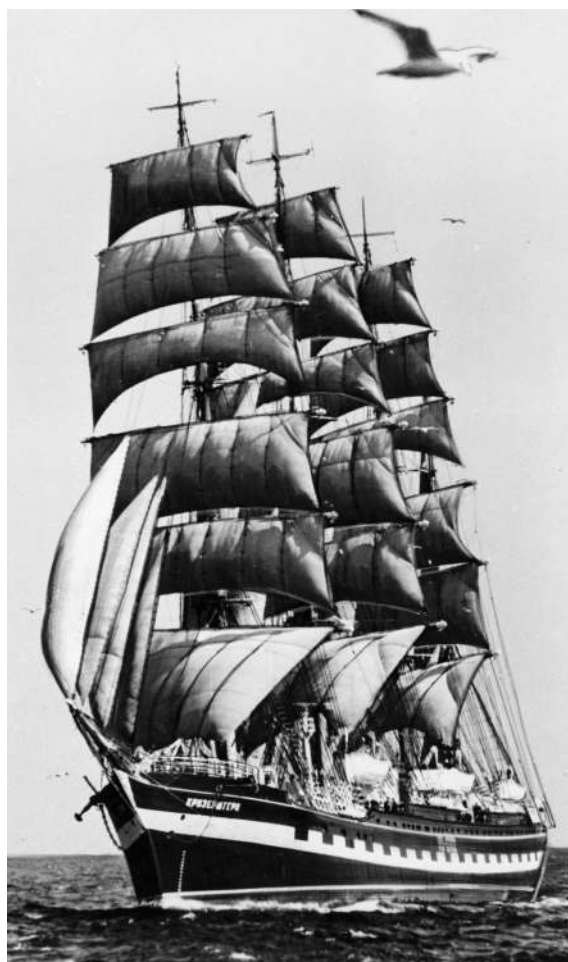
Современный парусник «Крузенштерн» совершил несколько кругосветных путешествий

Кроме экипажа на «Надежде» разместилось посольство под руководством Николая Резанова, чьей миссией было установление торговых отношений с Японией. Единственными иностранцами, приглашенными принять участие в путешествии, стали врач