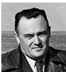
Сергей Королев Романтик космической эры