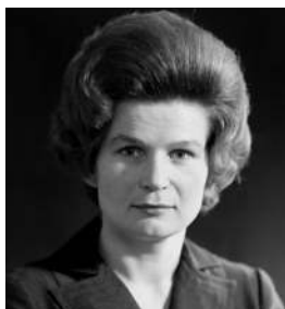
Валентина Терешкова Полет Чайки