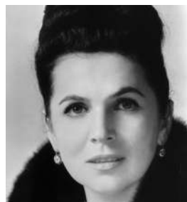
Галина Вишневская Женщина-эпоха