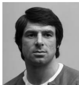
Валерий Харламов Лед и пламя советского хоккея