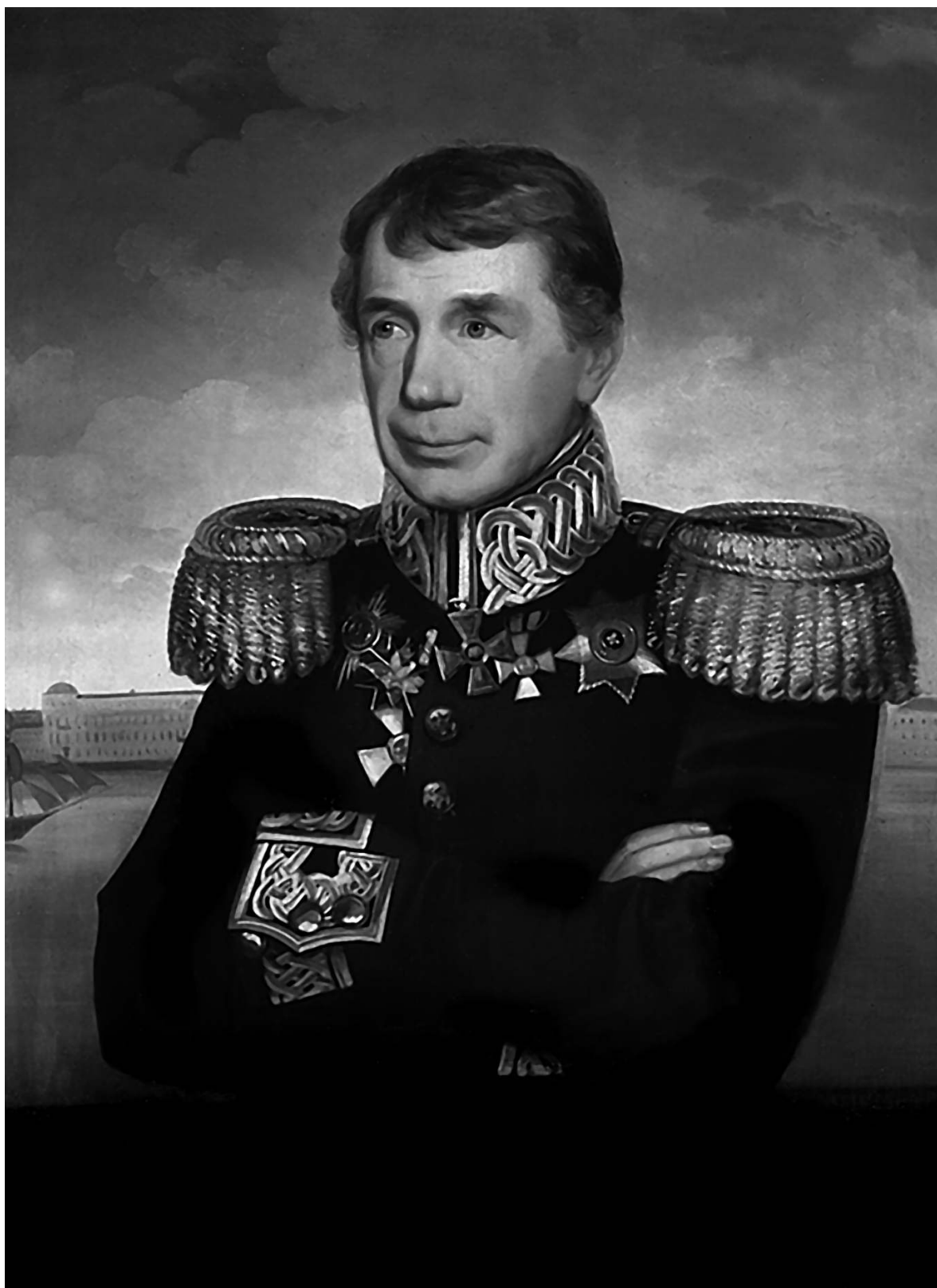
Возвращение Крузенштерна из путешествия было триумфальным (неизв. худ., XIX в.)