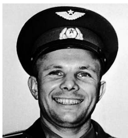
Юрий Гагарин Простой советский космонавт