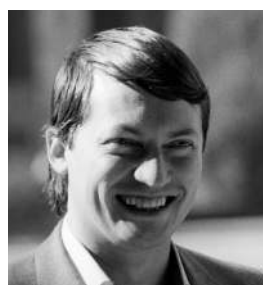
Анатолий Карпов Звезда ровного света