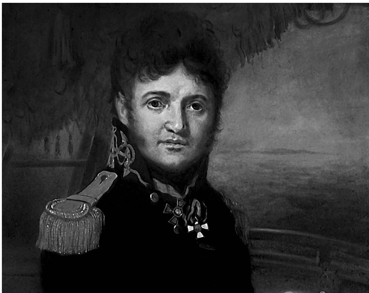
Капитан Юрий Лисянский командовал парусником «Нева» (худ. В. Л. Боровиковский, 1810)

свирепствуют сильные шторма. К счастью, обоим кораблям удалось благополучно достичь вод Тихого океана. 3 марта 1804 года «Надежда» и «Нева» впервые в истории российского флота обогнули мыс Горн.