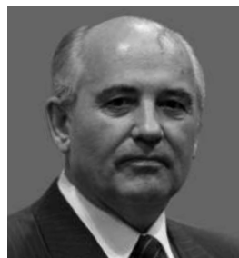
Михаил Горбачев Последний руководитель СССР