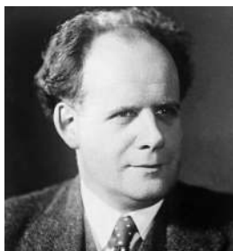
Сергей Эйзенштейн Жил, задумывался, увлекался