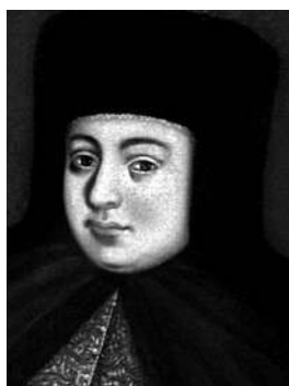
Наталья Нарышкина Мать Петра Великого