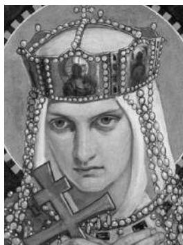
Княгиня Ольга Первая русская святая