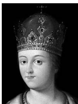
Царевна Софья Мятежная правительница Руси