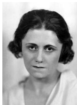
Ольга Хохлова Русская мадонна Пикассо