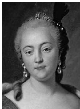
Елизавета Петровна Красавица на троне