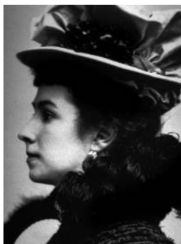
Матильда Кшесинская Прима дома Романовых