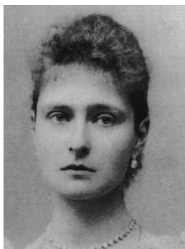
Александра Федоровна Последняя императрица