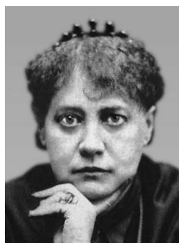
Елена Блаватская Русский Сфинкс