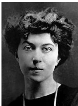
Александра Коллонтай Крылатый Эрос революции