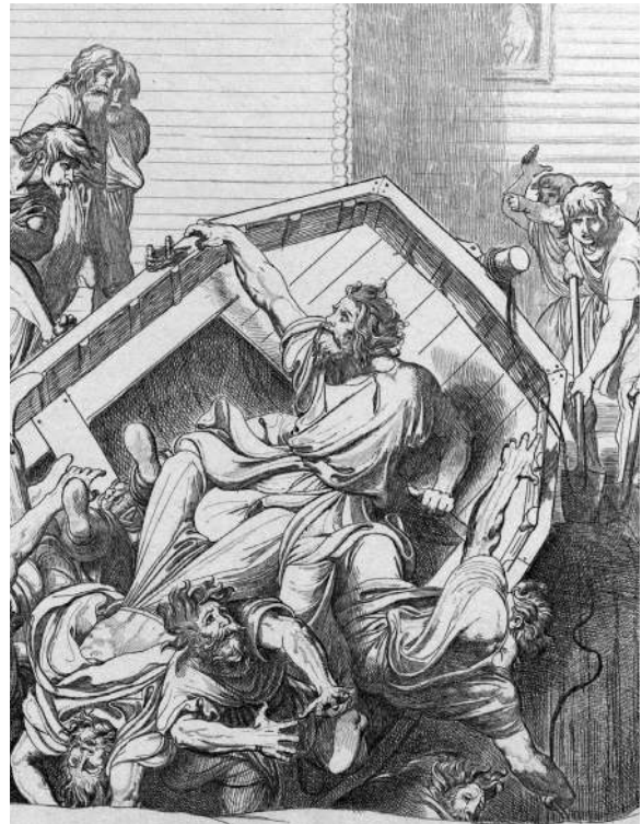
Месть Ольги древлянам за смерть мужа (гравюра Ф. А. Бруни, 1839)

Источники XIII века упоминают, что древний византийский крест находился в правой стороне алтаря храма Святой Софии, возведенного Ярославом Мудрым. Но в 1362 году, во время захвата Киева литовским князем Ольгердом, крест святой Ольги был похищен. Его дальнейшая судьба неизвестна.