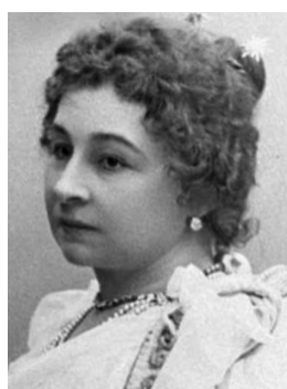
Мария Ермолова Большая звезда Малого театра