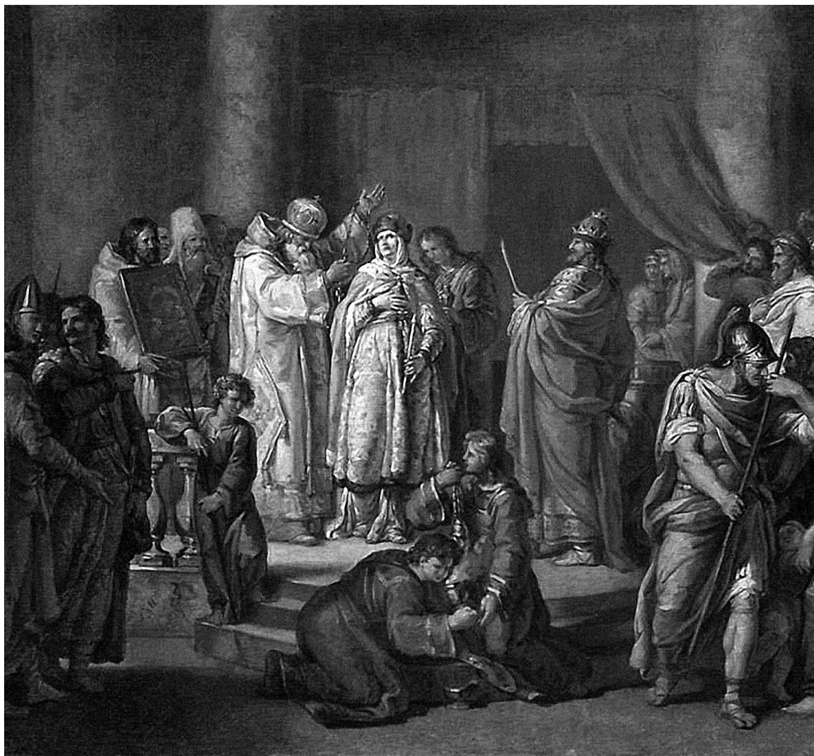
И. А. Акимов «Крещение княгини Ольги в Константинополе» (1792)

ный, «из немцев в хазары» — вел из Волжской Булгарии через киевские земли на Краков и Прагу с Подунавьем. Второй — водный, по рекам Луге и Западному Бугу — открывал путь на Балтику. Судя по археологическим находкам, в частности торговым пломбам, обнаруженным на различных раскопках в окрестностях города Дрогичина (Брестская область, Белоруссия), больше 80% торгового оборота княжества приходилось именно на этот район.