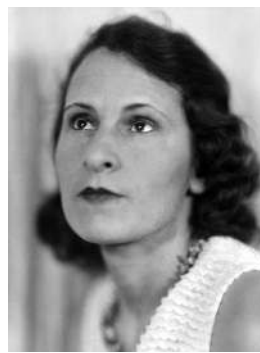
Гала Дали Муза двух гениев