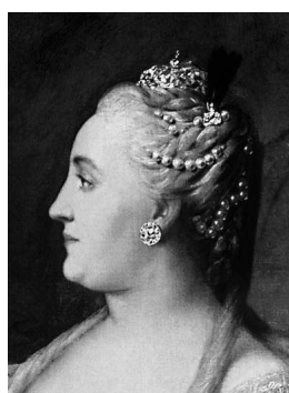
Екатерина II Императрица «золотого века»