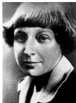
Марина Цветаева «Каждый стих — дитя любви»