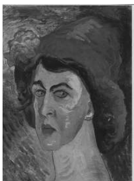
Марианна Веревкина Амазонка экспрессионизма