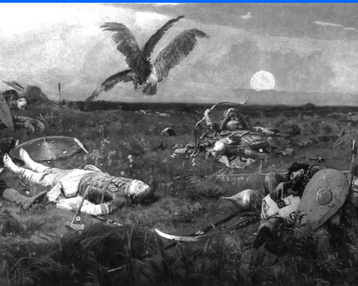
В. М. Васнецов «После побоища Игоря Святославовича с половцами» (1880)