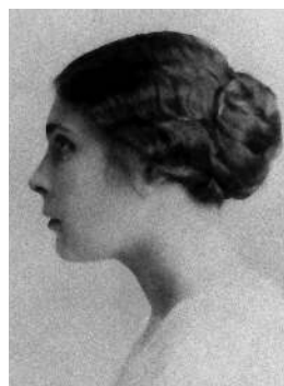
Лиля Брик Женщина- исключение