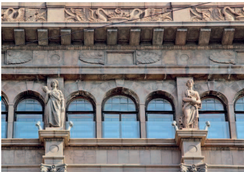
Фасад дома № 12 украшен скульптурами и барельефами