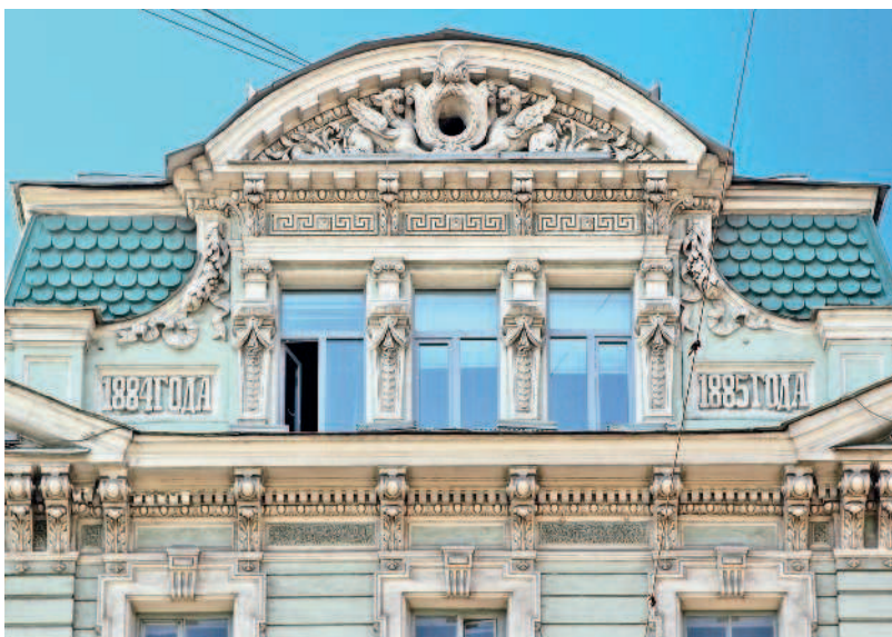
Примечательный фронтон дома № 5

мерческого акционерного банка. Здание облицевали светло-серым гранитом, темно-красным гнейсом и желтовато-серым песчаником, что придало ему парадный вид. В списке дирекции банка был промышленник К. Ф. Сименс. Учреждение действовало до 1917 года. В советский период в здании размещалось издательство «Прибой», литобъединение «Смена», Ленинградское отделение Российского телеграфного агентства и др.