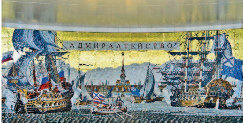
Мозаичное панно на станции метро «Адмиралтейская»

торый считается одним из самых красивых в мире. Гуляйте, получая наслаждение!