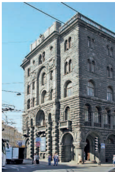
Доходный дом Вавельберга

5 Следуем дальше и делаем остановку на углу Малой Морской улицы, где находится станция метро «Адмиралтейская». Ваше внимание непременно привлечет внушительное здание под № 7–9. Это бывший доходный дом Вавельберга . Из-за гранитной облицовки оно кажется вырезанным из цельной скалы. Фасады украшены колоннами, пилястрами и декоративными скульптурными рельефами, от вида которых так и веет архитектурными традициями Италии. Его монументальность создает иллюзию, что дом находился здесь всегда. Однако если бы в нашем распоряжении была маши-