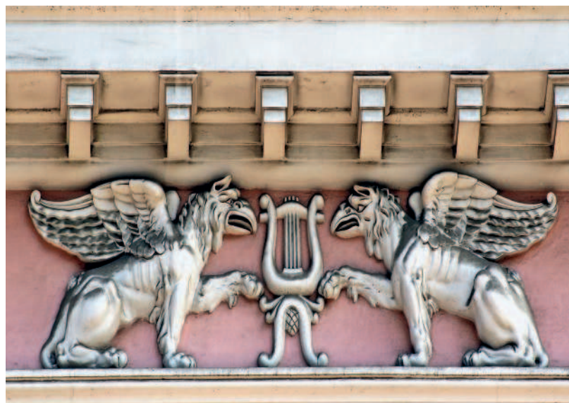
Дом № 8 украшают изображения грифонов

и на этом месте по проекту архитектора М. М. Перетятковича построил здание Санкт-Петербургского торгового банка, которое получило имя дом Вавельберга. Сам банк размещался на нижнем этаже, а верхние этажи были жилыми.