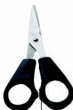
Ножницы для бумаги