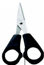
Ножницы для бумаги