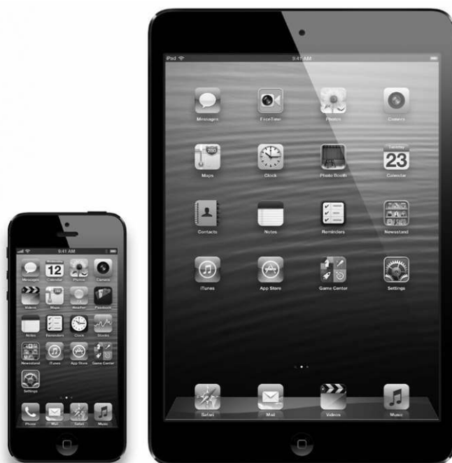
Рис. 1.2. Визуальное сравнение iPhone и iPad

Логическим продолжением смартфона стал iPad — он напрямую унаследовал все характерные черты своего предшественника. Нетрудно заметить их внешнее сходство: оба устройства имеют большие цветные экраны, всего одну кнопку на лицевой стороне и запоминающиеся названия, начинающиеся на «i» (рис. 1.2).