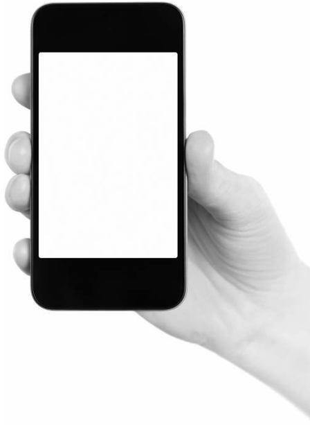
Рис. 1.3. Прежде всего iPhone — это телефон

Среди телефонов iPhone выделяется тем, что имеет очень удобный браузер (программу для просмотра веб-страниц) и прогрессивную виртуальную клавиатуру, что сделало его незаменимым спутником любителей Интернета.