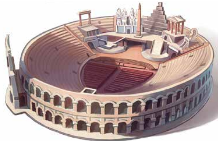
Арена ди Верона, опера в Вероне, Италия

Современные здания поражают оригинальностью. Оперу в Сиднее сравнивают с парусами и раковинами, в Осло — с айсбергом.