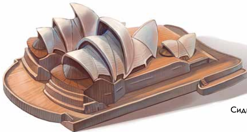
Сиднейский оперный театр, Сидней, Австралия

Большинство оперных театров выглядят как дворцы. Некоторые даже чем-то похожи друг на друга. Самые восхитительные и удачные становились образцами для подражания. Например, оперный театр в Одессе похож на оперу в Дрездене.