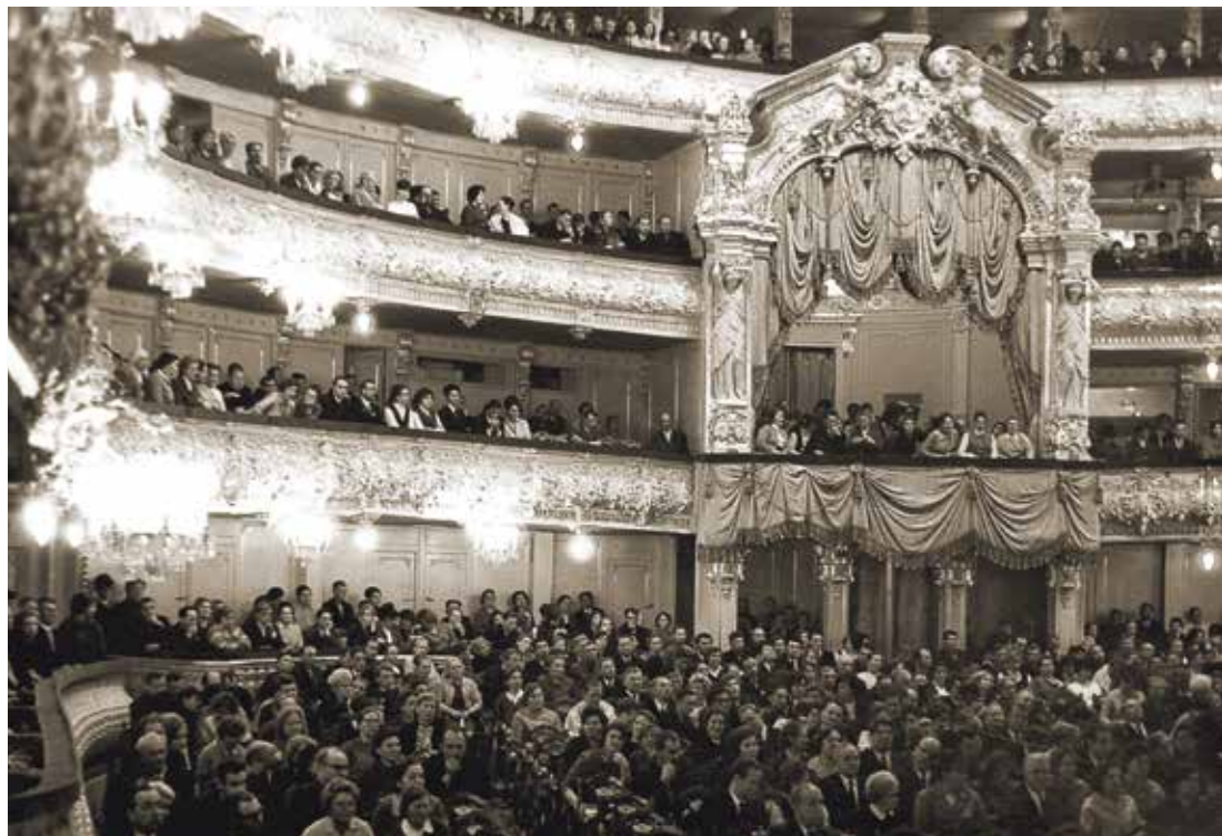
Мариинский театр (театр им. С. М. Кирова). Интерьер зала, 1972

О ПЕРНЫЙ театр похож на шкатулку с секретом — красив снаружи, но ещё интереснее внутри. Первый уровень волшебства открывается, когда проходишь внутрь и попадаешь в фойе. Второй — великолепный зрительный зал: обитые бархатом кресла, позолота и барельефы, скульптуры и драпировки. Третий — самое сердце театра: то, что происходит на сцене, когда поднимается занавес. Но пока занавес закрыт, можно занять свои места и хорошенько оглядеться.