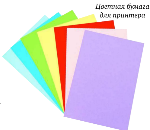
Цветная бумага для принтера

Фольгированная бумага поможет создать эффект стекла или воды.