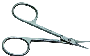
Ножницы с закругленными лезвиями