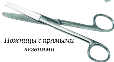
Ножницы с прямыми лезвиями