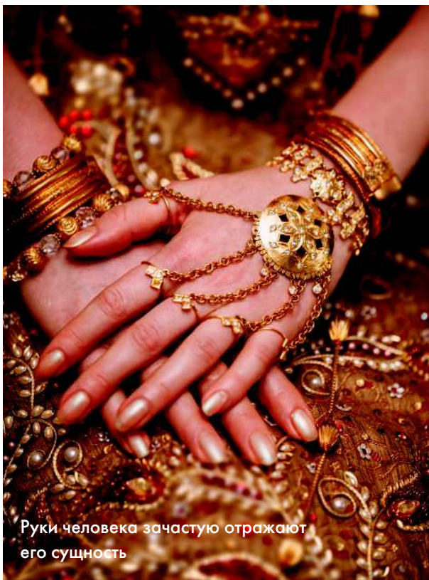
Руки человека зачастую отражают его сущность

Любые химические процессы, протекающие в теле человека, также обязательно отражаются на руках. Например, цвет кожи и текстура ногтей удобны для диагностики и могут сообщать врачам важную информацию о состоянии здоровья пациента.