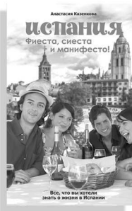
«Испания. Фиеста, сиеста и манифесто!»