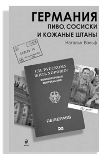
«Германия. Пиво, сосиски и кожаные штаны»