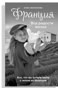
«Франция. Все радости жизни»