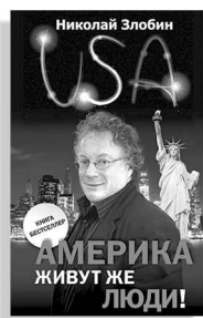
«Америка... Живут же люди!»