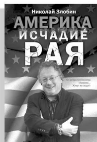
«Америка: исчадие рая»