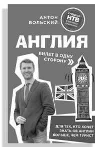
«Англия. билет в одну сторону»