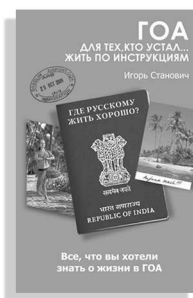
«Гоа. Для тех, кто устал... жить по инструкциям»