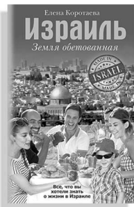
«Израиль. Земля обетованная»