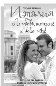
«Италия. Любовь, шопинг и dolce vita!»