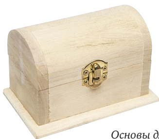
Основы для росписи