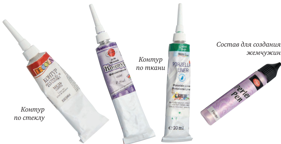
Контур по стеклу

разных материалах: вы можете приобретать любые. Контуры для разных поверхностей различаются только консистенцией: так, контуры по стеклу более густые, чем контуры по ткани (разумеется, внутри линейки материалов одного производителя).