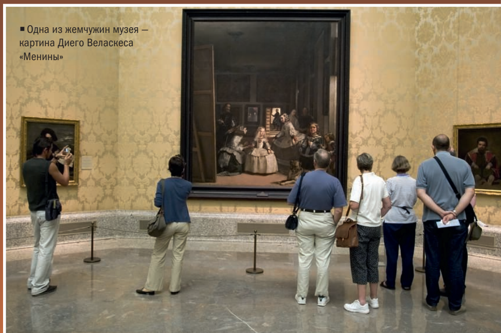
■ Одна из жемчужин музея — картина Диего Веласкеса «Менины»

же, испанской. В просторных залах представлены картины Рембрандта, Боттичелли, Пуссена, Веласкеса, Гойи, Босха и других великих мастеров. Чтобы посмотреть на них, в Прадо ежегодно приезжает около 2 млн туристов.