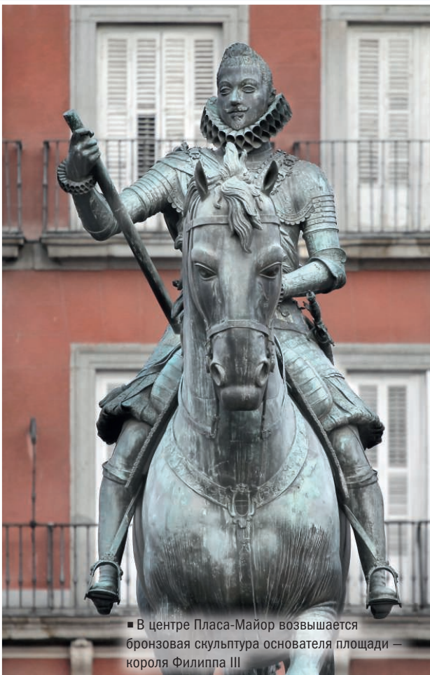
■ В центре Пласа-Майор возвышается бронзовая скульптура основателя площади — короля Филиппа III