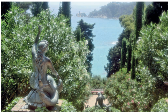
Сады святой Клотильды

Вечер. Вернувшись в Льорет-де-Мар, почувствуйте его неповторимую ночную жизнь. Если вас не интересуют тусовки, можете устроить себе спокойный вечер – спуститесь от автовокзала в сады святой Клотильды и подышите воздухом, наполненным ароматами, которые источает средиземноморская флора.