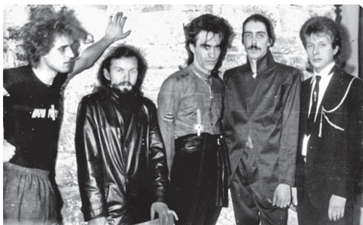
«Наутилус Помпилиус»: 1989 год

щий и редактор на телевидении и в газетах, делал сольные альбомы. Но рок миновал, наступили попса и шансон.