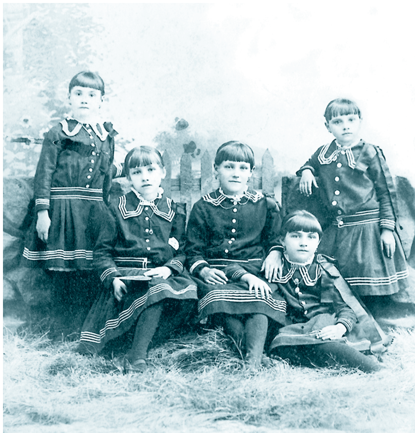
Таким могло быть детство Габриэль Бонер и ее сестер. Французские девочки. Фото начала XX века