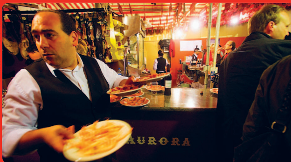
STANDO DELLY / ASPINERS

(слева) пляж «Балкон Европы», Нерха (с. 189), провинция Малага (внизу) бар тапас в Санлукаре-де-Баррамеда (с. 124), провинция Кадис