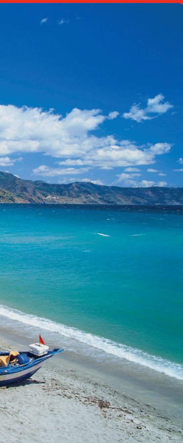
STANDO DELLY / ASPINERS

Легкий аромат цветущих апельсиновых деревьев, мелодии фламенко, срывающиеся со струн гитары, яркий всполох плаща матадора... Воспоминания об Андалусии останутся с вами, подобно драгоценным сувенирам, вновь и вновь зовущим вернуться сюда