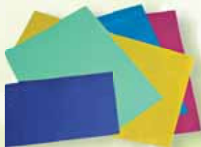
Цветная бумага: салатовая, светло- бежевая, желтая, зеленая, красная