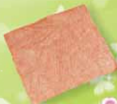
Кусочек фактурной бумаги или обоев