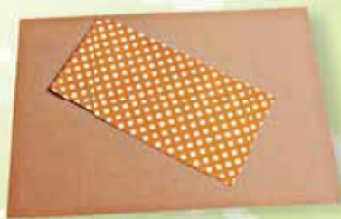
Цветная бумага: бежевая, белая, в горошек