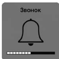
Рис. 2.4. Меняем уровень громкости динамиков