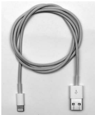
Рис. 2.2. USB-кабель iPhone