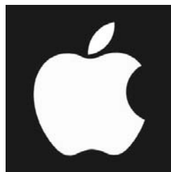
Рис. 2.6. Логотип Apple

Нажатием кнопки Включение/Выключение смартфона также можно выключить iPhone. Для этого подержите несколько секунд нажатой верхнюю кнопку, после чего на экране появится панель с предложением выключить устройство (Выключить) или отменить действие (Отменить). Для того чтобы включить iPhone, нужно повторить то же действие — подержать несколько секунд нажатой верхнюю кнопку, пока на экране не отобразится логотип Apple (рис. 2.6).