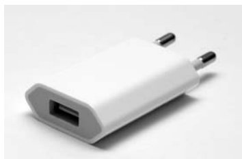
Рис. 2.3. Адаптер для зарядки iPhone от электрической сети