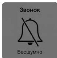
Рис. 2.5. Звук выключен