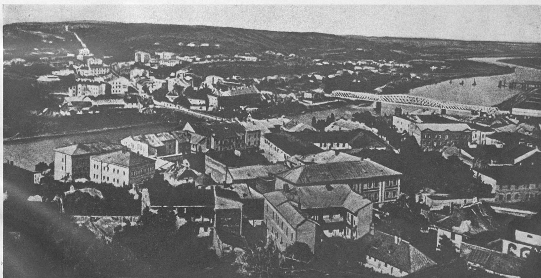
Общій видъ Перемышля.