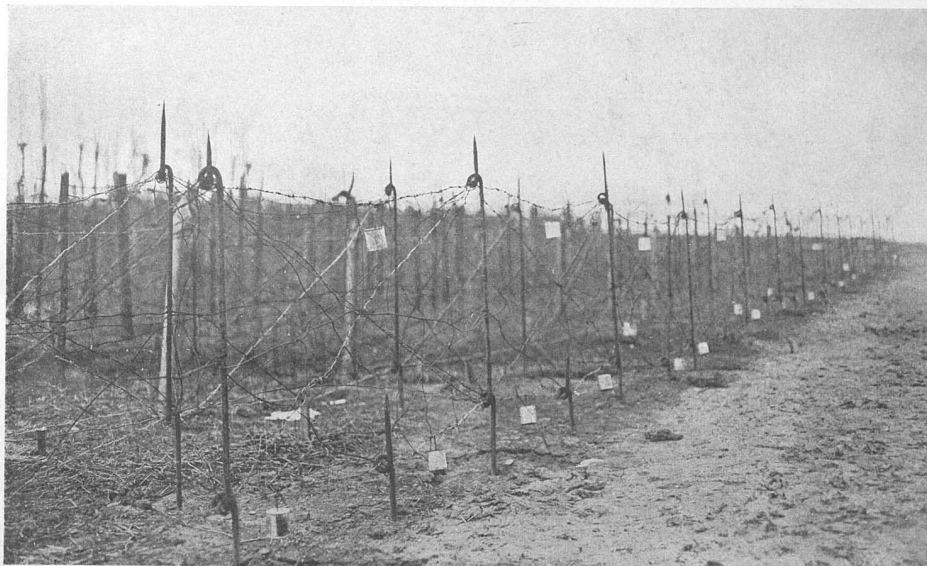
Проволочныя за- гражденія передъ фортами съ привя- заннами банками отъ консервовъ.