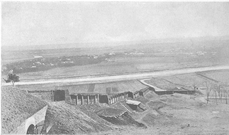
Видъ съ форта на Перемышля.