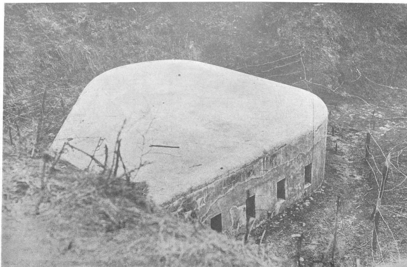
Бетонный каземат на форту.