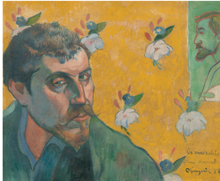
«Автопортрет, посвященный Винсенту Ван Гогу. Отверженные», 1888, холст, масло. Музей Ван Гога, Амстердам

Однако учеба, которая поначалу казалась интересной, быстро наскучила юному Полю, а воспоминания о привольной жизни в Перу все чаще и чаще не давали ему покоя. При