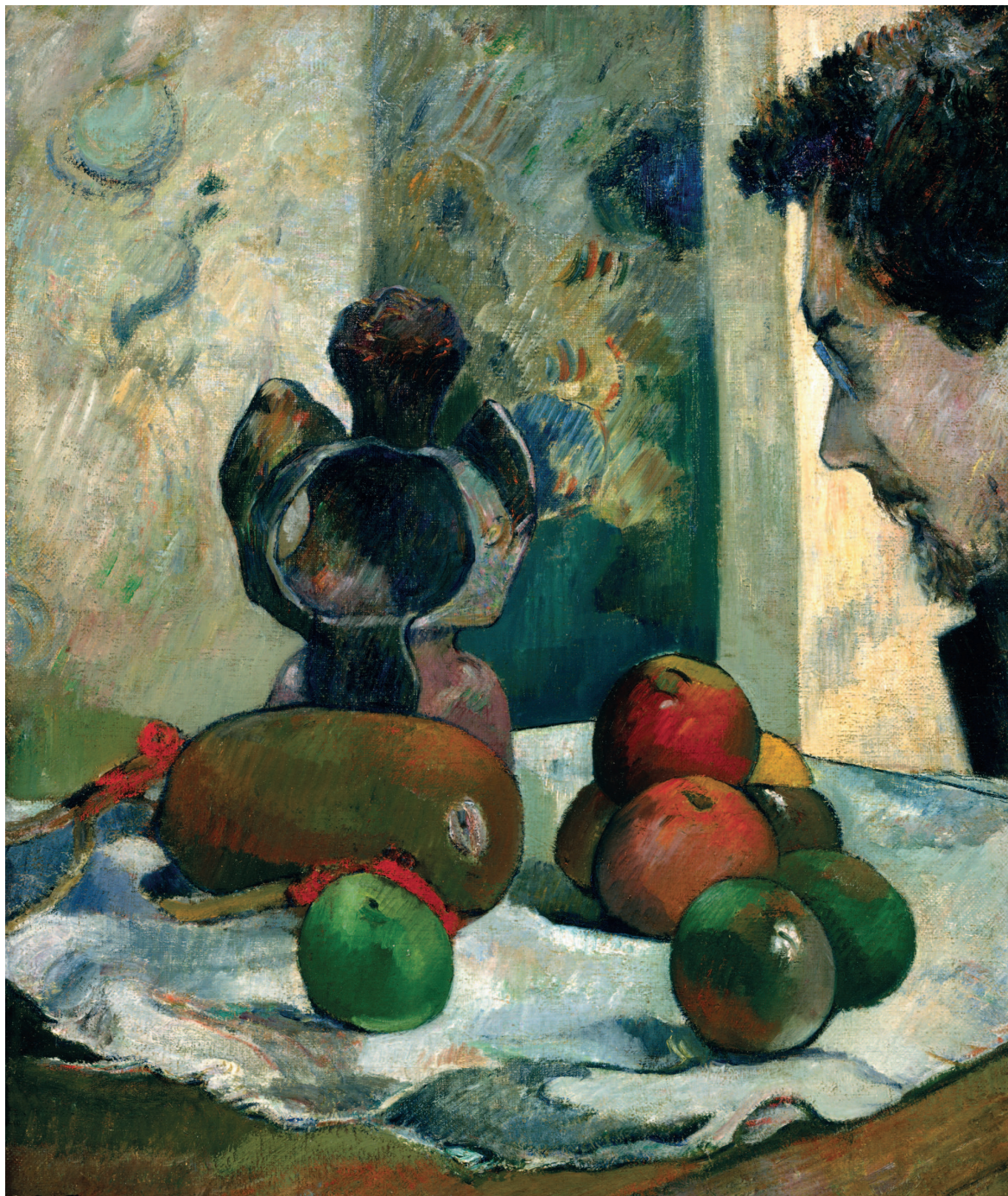
«Натюрморт с профилем Шарля Лаваля», 1886, холст, масло. Частная коллекция