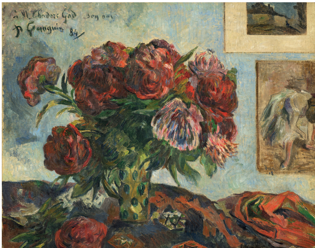
«Натюрморт с пионами», 1884, холст, масло. Национальная галерея искусств, Вашингтон

Гоген прожил в Перу до семилетнего возраста, воспитываясь в семье матери. Детские впе-