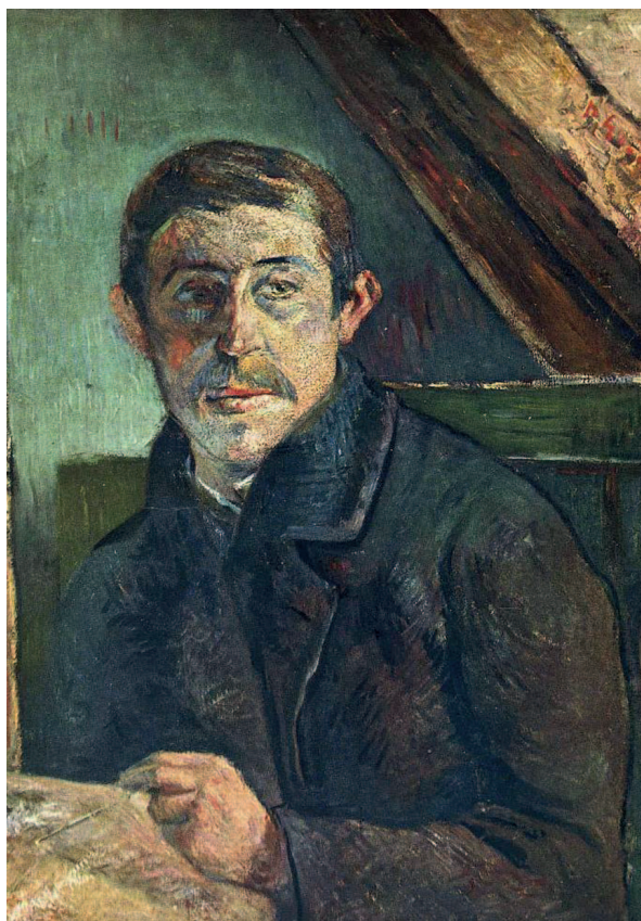
«Автопортрет за мольбертом», 1885, холст, масло.

Жизнь художника можно воспринимать лишь как одну из граней его творчества. И как в творчестве, так и в жизни Гогена все необычно, противоречиво, запутанно, но при этом ярко и красочно.