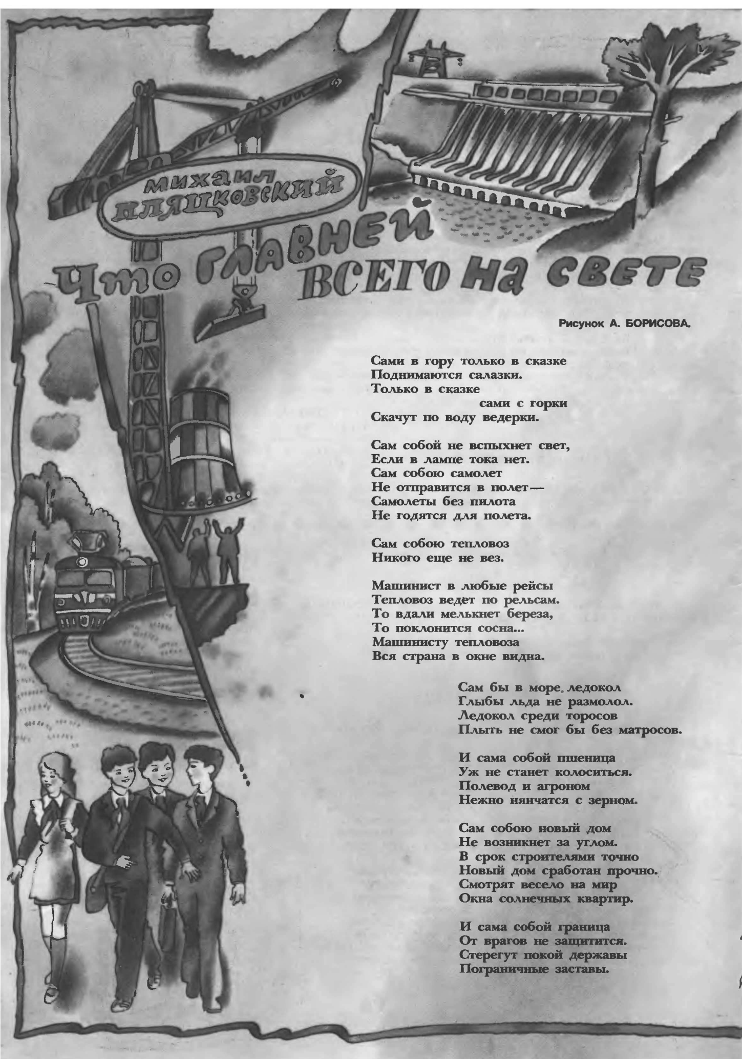
Рисунок А. БОРИСОВА.

Сами в гору только в сказке Поднимаются салазки. Только в сказке