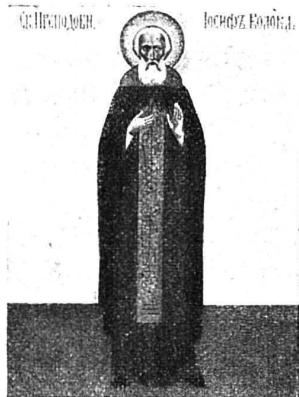
Преп. Иосифъ Волоколамскій.

Божіемъ. Болѣе полустолѣтія подвизался въ монашествѣ преподобный Давидъ и былъ кормильцемъ-отцемъ всего окрестнаго населенія. 19 сентября 1529 года 1) онъ предалъ Богу свою праведную душу, а честное тѣло его, изнуренное трудами и подвигами, было погребено въ осно-