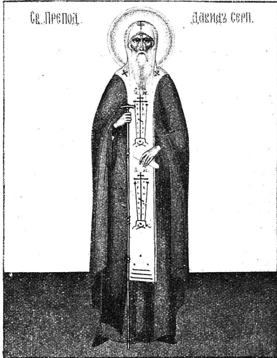
Преп. Давидъ Серпуховской.

Старець ударилъ меня по ногамъ жезломъ, велѣлъ идти въ Подольскъ и сталъ невидимъ. Тутъ я, къ вели-