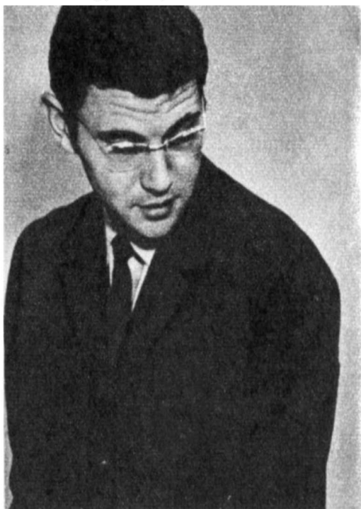
«Инспектор и ночь»

нова, «Волчица», хотя на первый взгляд Кондов не похож на Инспектора: он лишен многословия, не склонен к самоиронии, не страдает приступами колебаний, тревожными сомнениями, и все же, искренний, простой, даже несколько простоватый, он создан для действия. Всю свою жизнь он подчинил основной педагогической задаче, которую новое время поставило перед ним как перед воспитателем и гражданином — коммунистом. Он принадлежит к той категории людей, которые, взявшись однажды за выполнение определенной работы, доводят ее