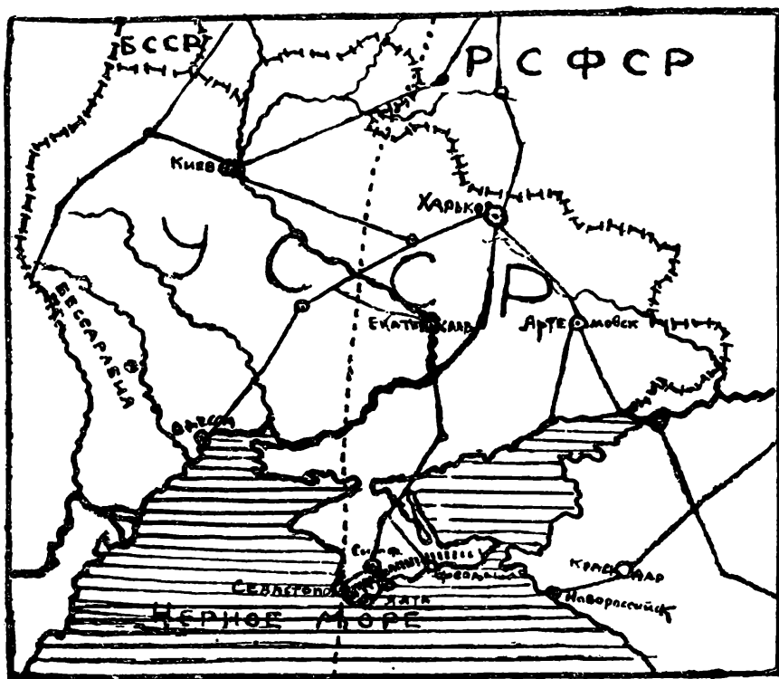
Рис. 4. Карта УССР.