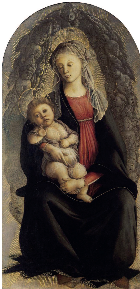
«Мадонна во славе», около 1469–1470, темпера. Галерея Уффици, Флоренция

Сандро Боттичелли часто использовал знания, полученные им еще в мастерской брата. Отсюда и четкость линий, и любовь к золоту, которое художник часто примешивал к краскам или использовал в чистом виде.