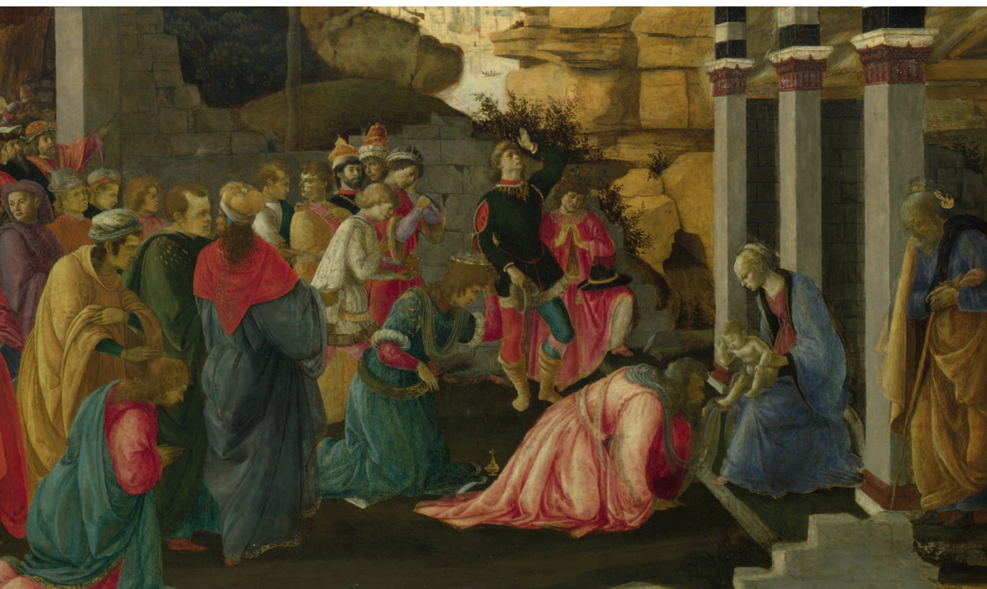
«Поклонение волхвов» (фрагмент), 1470, дерево, темпера. Лондонская Национальная галерея, Лондон

В изображении Девы Марии художник органично сочетает черты героинь Филиппо Липпи и Андреа де Верроккьо. Впрочем, уже