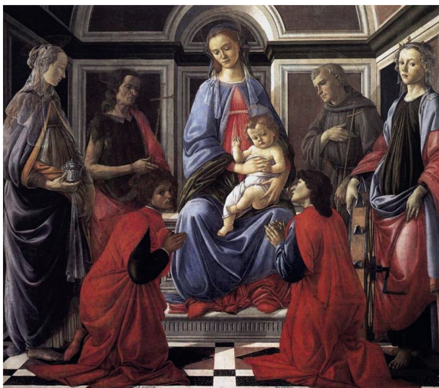
«Мадонна с Младенцем и шестью святыми», около 1470, темпера. Галерея Уффици, Флоренция

рой восседает Младенец-Спаситель. Голова Богородицы слегка наклонена, взгляд ее задумчив, и нам сложно сказать, куда именно она смотрит. Правой рукой она прикасается к хлебному колоску, который вместе с гроздьями винограда на