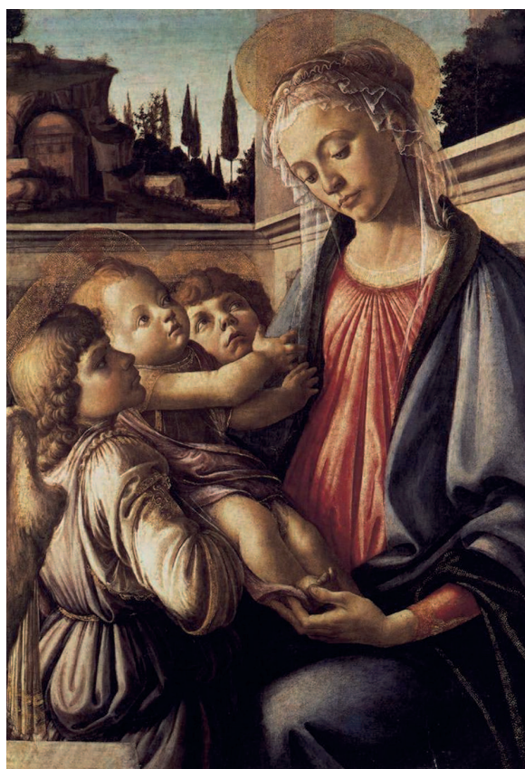
«Мадонна с Младенцем и двумя ангелами», 1468–1470, темпера. Национальный музей и галерея Каподимонте, Неаполь

Занимаясь ювелирным делом, Боттичелли многому научился. Ему приходилось постоянно рисовать эскизы украшений, и вскоре юноша всерьез увлекся живописью, которой он и решил посвятить всю свою жизнь. Впоследствии