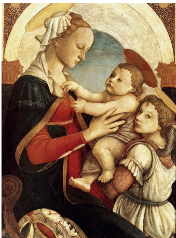
«Мадонна с Младенцем и ангелом», 1465–1467, дерево, темпера. Воспитательный дом, Флоренция

Боттичелли создал множество шедевров на религиозные темы и один из первых заинтересовался античными мифами, а в своем творчестве начал частенько прибегать к аллегории. Именно Боттичелли подарил миру один из идеалов женской красоты. И отчасти именно благо-