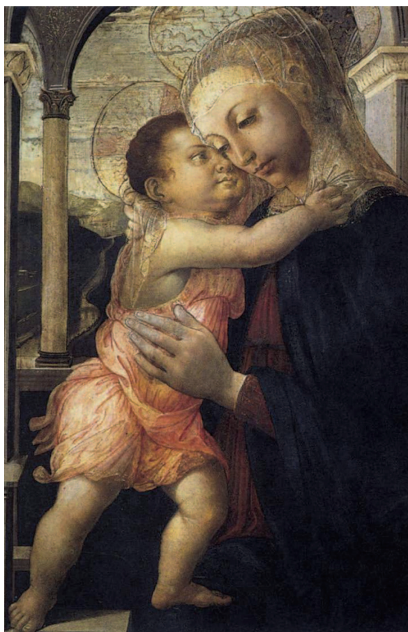
«Мадонна делла Лоджиа», 1467, дерево, масло. Галерея Уффици, Флоренция

Первое упоминание об Александро, как и о других флорентийских художниках, встречается в приведенном кадастре — официальном документе, куда вносились записи о доходах всех местных семей и собираемых с них налогах. Начальное образование Александро вместе с братьями получал в доминиканском монастыре Санта Мария Новелла, для которого позже выполнил ряд заказов. После этого юный Боттичелли подвизался подмастерьем в ювелирной мастерской своего брата Антонио. А надо ска-