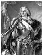
Август II Сильный.

Август II Сильный. (1670–1733). Курфюрст саксонский (под именем Фридриха Августа I) с 1694, король польский в 1697–1706, 1709–33 (в 1706–09 отрекся от престола в пользу С. Лещинского); союзник России в Сев. войне 1700–21; в годы его правления в Дрез-