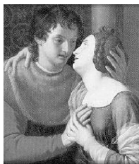
Абеляр и Элоиза.

Абеля́р Пьер. (1079–1142). Франц. философ, теолог и поэт, развивший в споре о природе универсалий учение, назв. позже концептуализмом; разработал схоластич. диалектику,