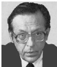
Л. И. Абалкин.

Аба́лкин Леон. Ив. (р. 1930). Рос. экономист; осн. труды по теоретическим и методологическим проблемам политэкономии; с 1986 директор Института экономики РАН; в 1989–91 зам. пред. Совета министров СССР.