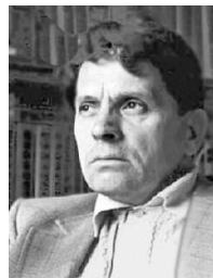
Ф. А. Абрамов.

Абу́ Тамма́м. (ок. 796–843). Араб. поэт, автор элегич., панегирич., сатирич. стих., составитель антологии араб. поэзии.