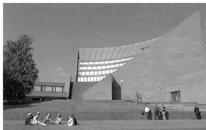
Алвар Аалто. Главный корпус Хельсинкского политехнического университета в Отаниеми.

зиции, вписанной в природную или гор. среду. • Финск. Aalto. Осн. постройки: санаторий в Паймио (1929–33); дворец «Финляндия» в Хельсинки (1967–71).