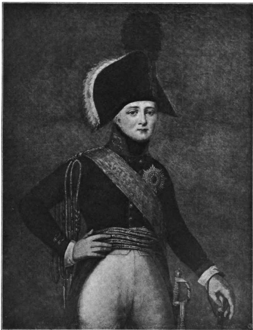
Императоръ Александръ I.