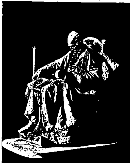
Иоаннъ Грозный—завоеватель Астрахани (со статуи Антокольскаго).

Астраханскій край, со временъ глубочайшей древности, былъ мѣстомъ кочевій дикихъ племенъ Азіи, переселявшихся въ Европу. Скифы, сарматы, аланы, гунны, акациры, авары, угры и многіе другіе варвары, попеременно, обитали въ Астраханскомъ краѣ, въ предѣлахъ того пространства, которое было свободно отъ водъ Каспійскаго моря. Последнее, какъ извѣстно, простиралось много сѣвернѣе. Позднѣе, уже по Рождествѣ Христовомъ, изъ остатковъ временно пребывавшихъ въ приволжскихъ степяхъ народовъ, образовался союзъ племенъ, превратившійся впослѣдствіи въ могущественную Хозарскую державу, владѣвшую всѣмъ югомъ нынѣшней Россіи. Могущество хозарь