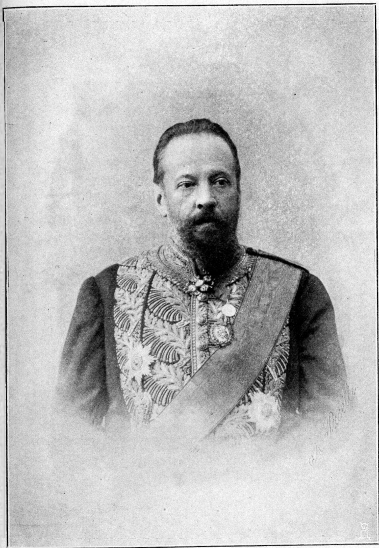
Шефъ Пограничной Стражи, Министръ Финансовъ, Статсъ-Секретарь С. Ю. Витте.