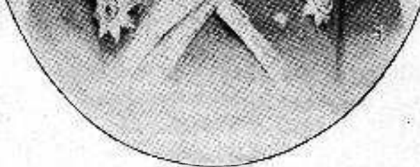
Помощник Командира Стѣльнаго Корпуса Пограничной Стражи, Генераль-Лейтенантъ А. Т. Озеровскій. (1893, 1894 и 1900 г.).