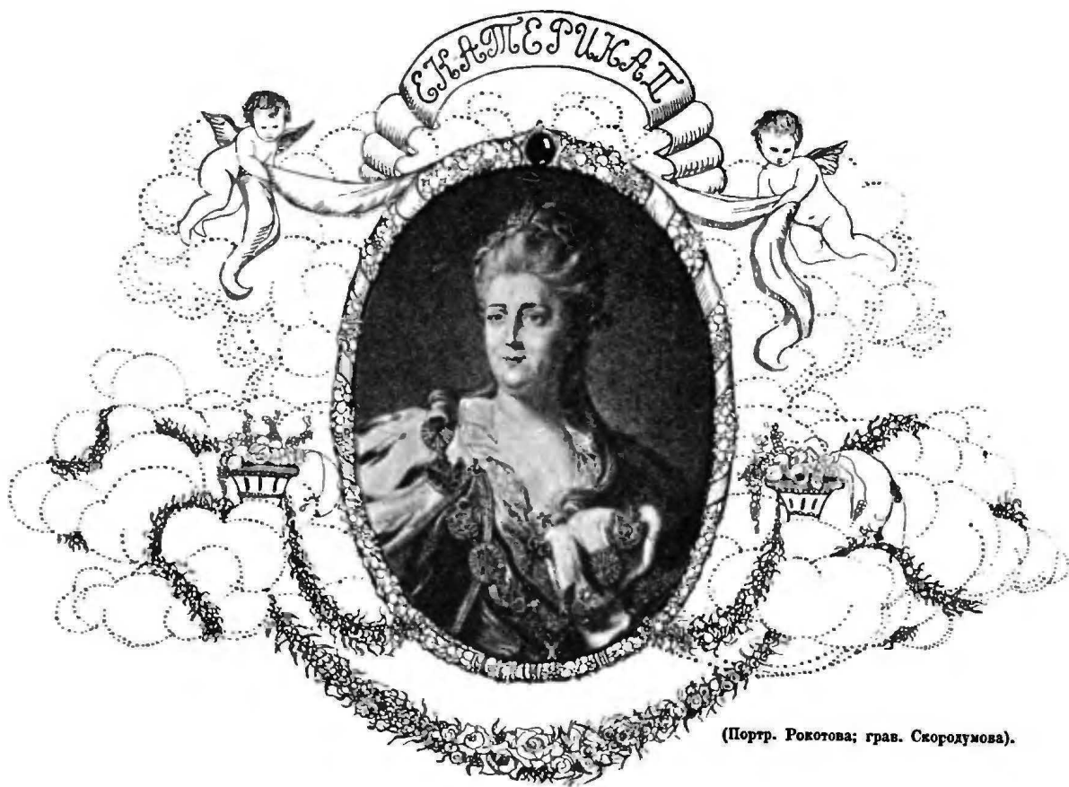
(Портр. Рокотова; грав. Скородумова).