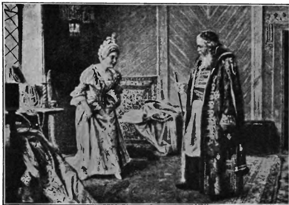
Первый реверансъ (Пашъ).

Послѣ Ништадтскаго мира Кампредонъ въ 1721 году сдѣлался полномочнымъ министромъ при русскомъ дворѣ. До того времени онъ стоялъ на сторонѣ Швеціи; теперь же сдѣлался ревностнымъ сторонникомъ франко-русскаго союза. Благодаря содѣйствію Кампредона, 12 іюня 1724 г. былъ заключенъ русско-турецкій договоръ, которымъ предотвращена война между Россіей и Турціей и разграничены ихъ владѣнія на Кавказѣ; Кампредонъ старался также помирить русскаго императора съ англійскимъ королемъ. Въ Парижѣ, однако, не дѣлили такой политики и довольно равнодушно относились къ дружбѣ съ Россіей.