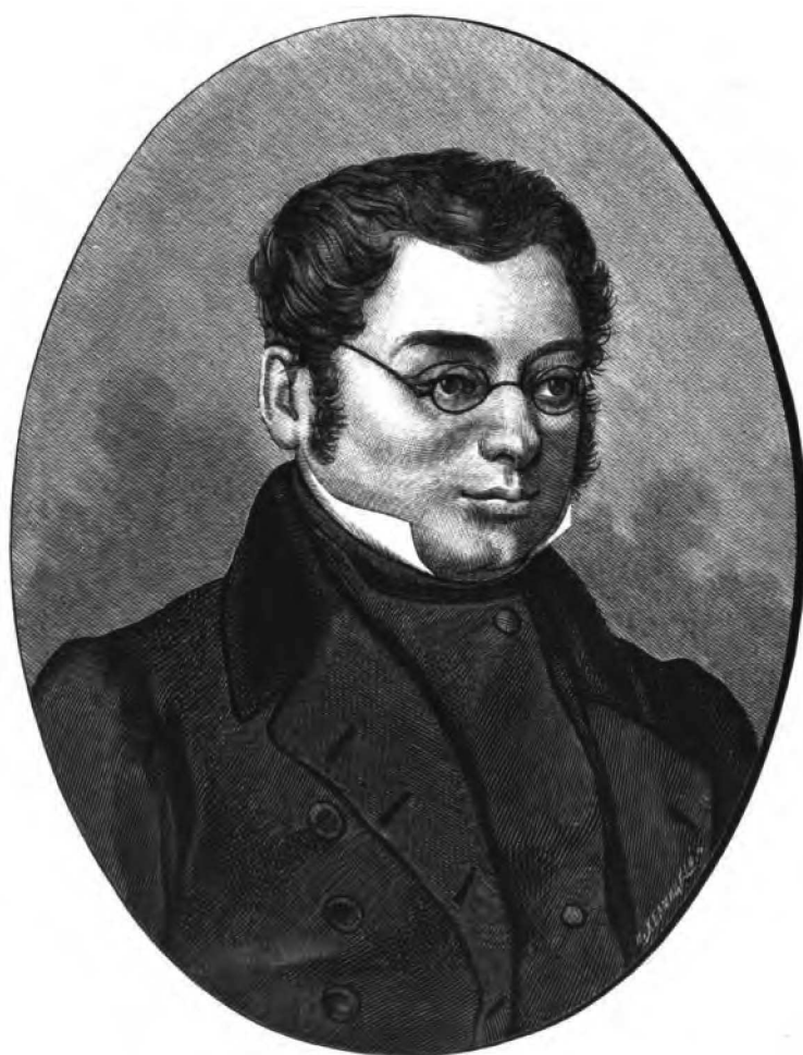
МИХАИЛЪ НИКОЛАЕВИЧЪ ЗАГОСКИНЪ.