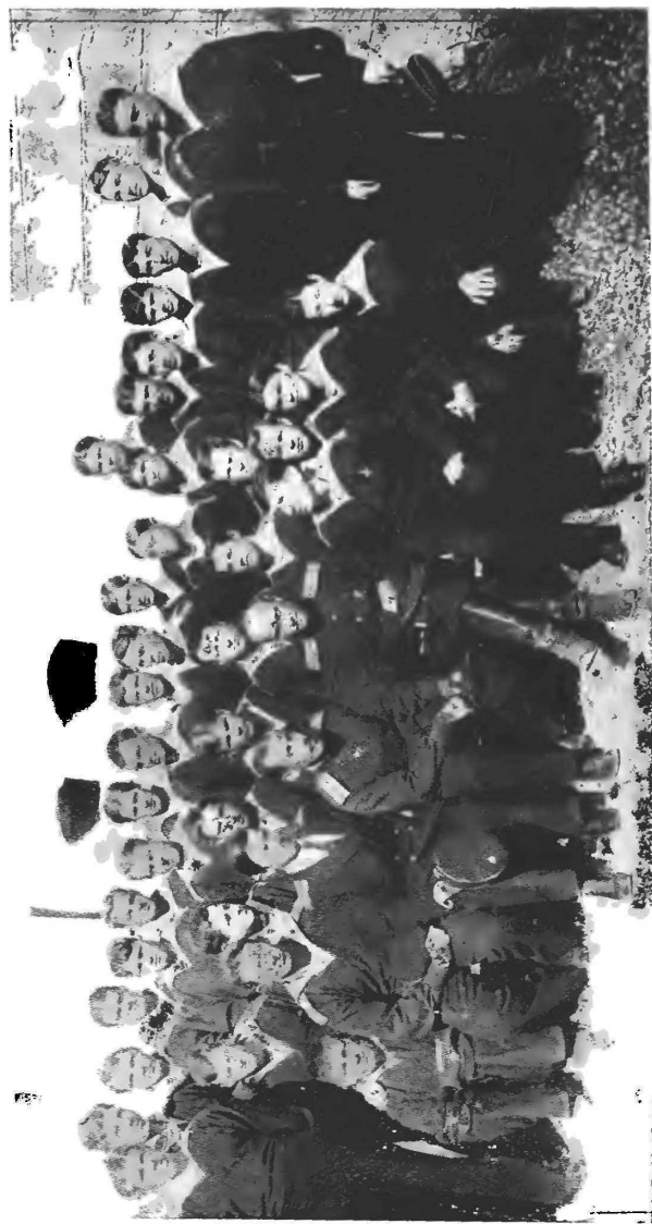
Гардемаршы 1-ой роты.