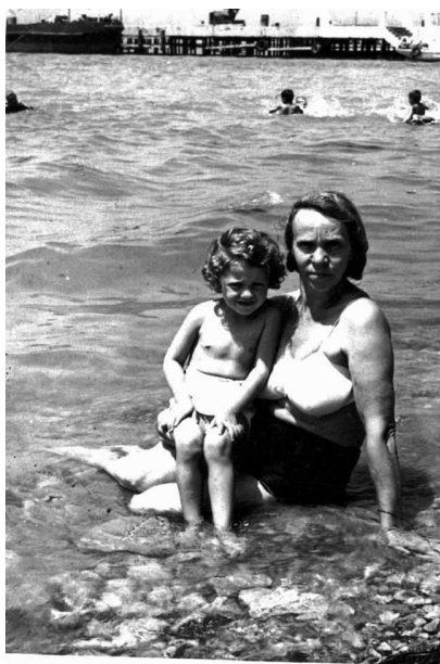
Мама и я о купанье в Геленджике 1957

Вокруг домика был небольшой сад. У отцовского забора стояло огромное дерево, срезанное наполовину осколком снаряда. Мне говорили, что в саду упала бомба во время войны, когда фашисты бомбили порт Новороссийска, всего в сорока километрах от Геленджика. Вот поэтому наш домик покосился, и жить в нем было опасно. Мне было страшно слушать, как к нашему домику долетали снаряды и подвергали всех смертельной опасности.