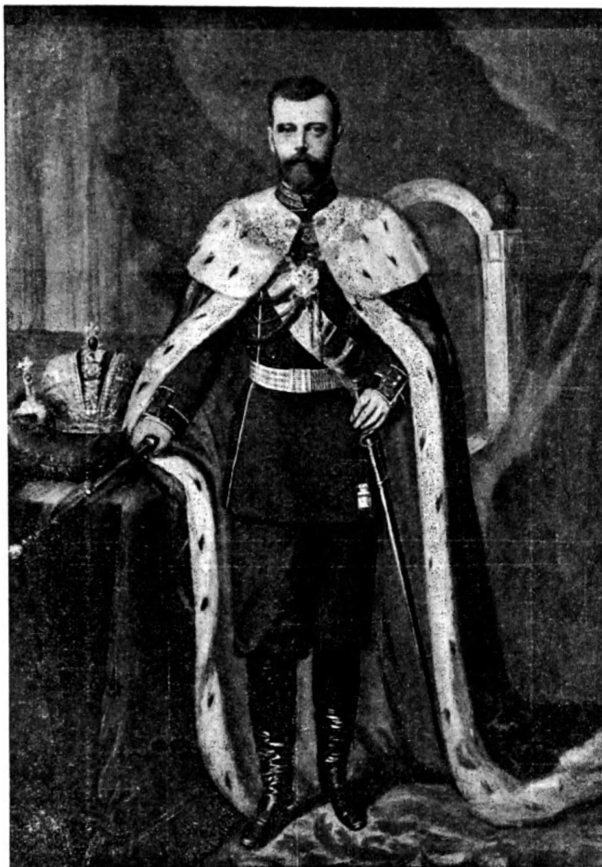
Его Императорское Величество Государь Императоръ Николай Александровичъ.