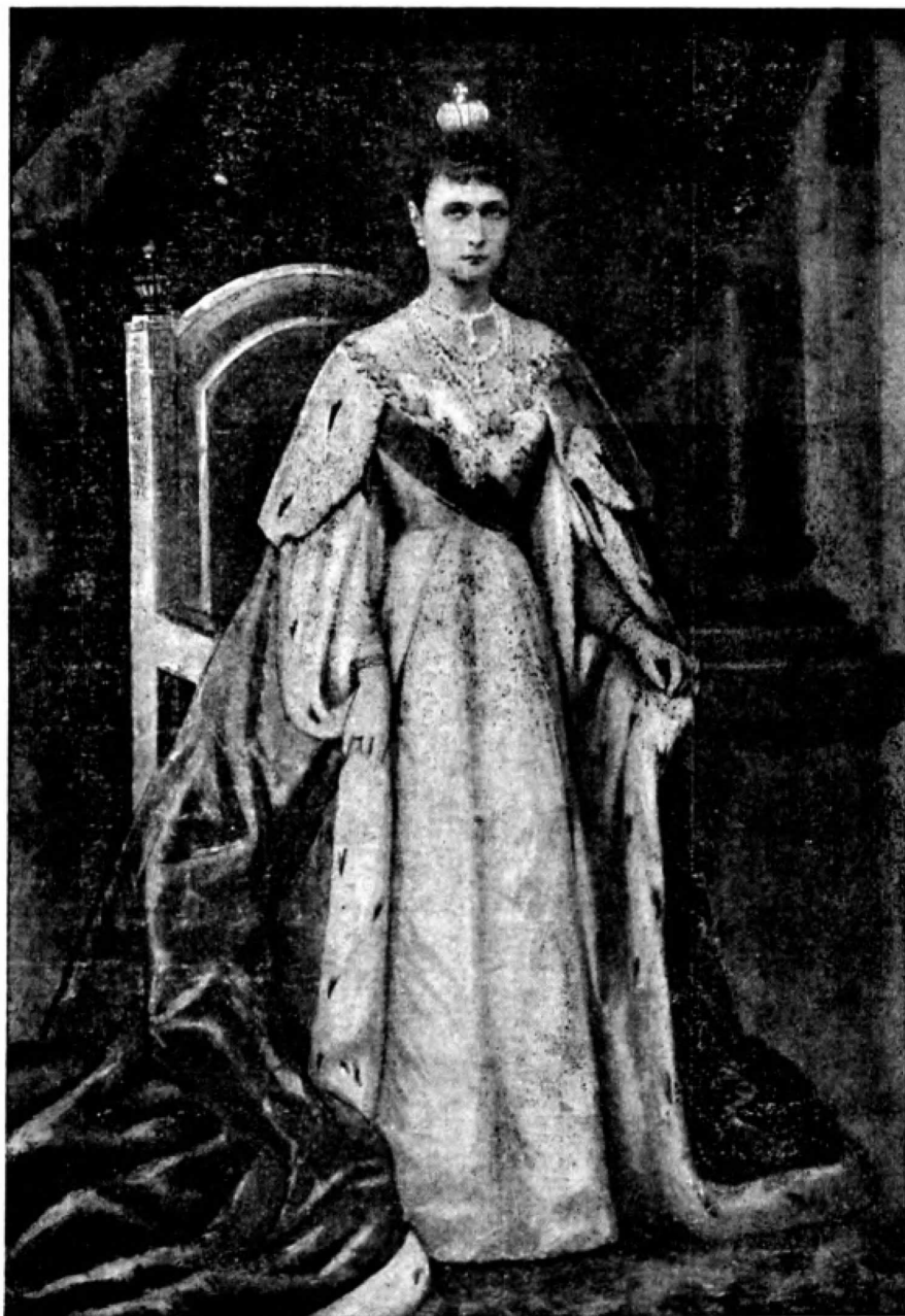
Ея Императорское Величество Государыня Императрица Александра Феодоровна.