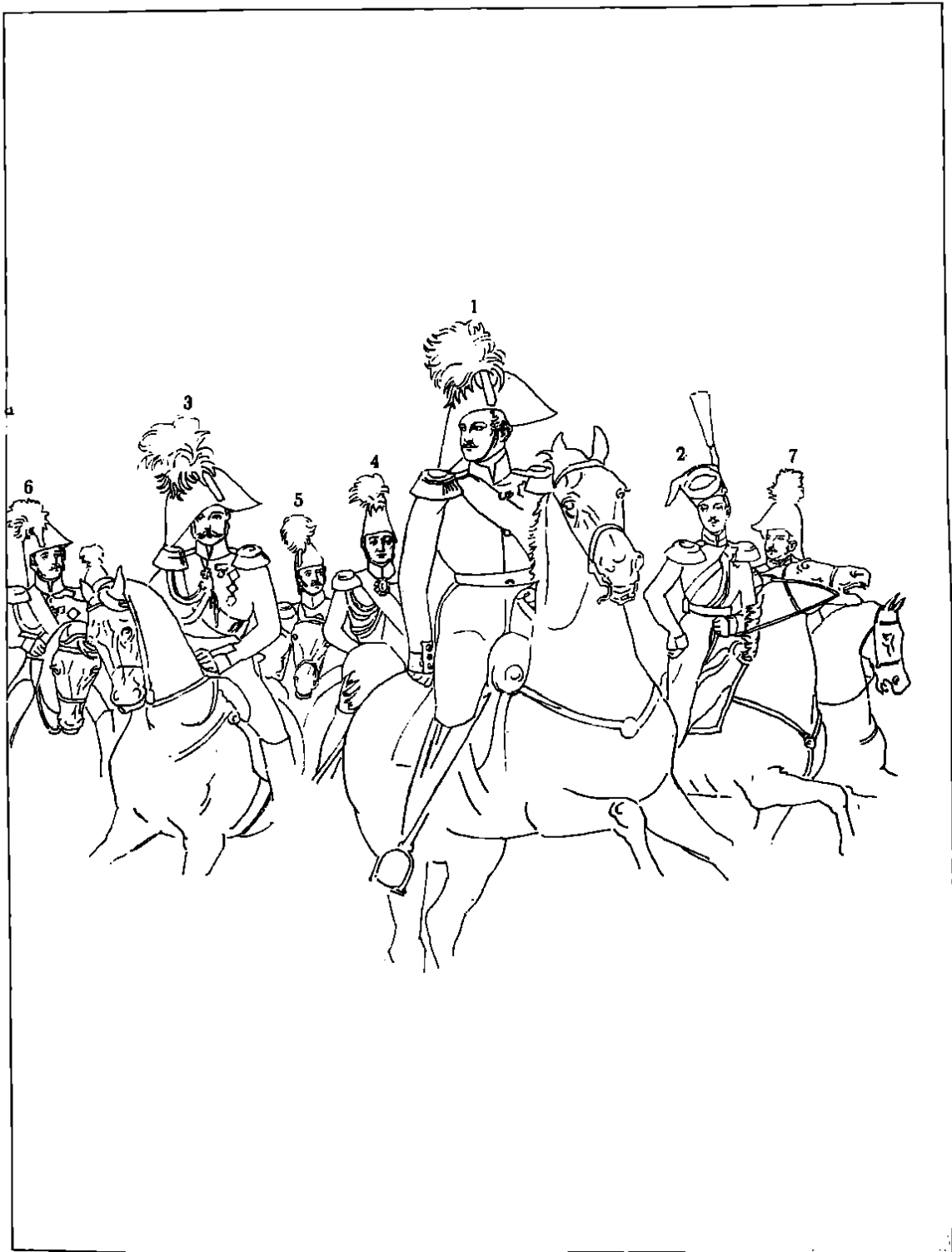
1—Государь Императоръ НИКОЛАЙ ПАВЛОВИЧЪ; 2—Государь Наслѣдникъ Цесаревичъ и Великій Князь Александръ Николаевичъ; 3—Великій Князь Михаилъ Павловичъ; 4—Генераль-адъютантъ, Свѣтлѣйшій князь П. М. Волконскій, Министръ Двора; 5—Генераль-адъютантъ, графъ А. Х. Бенкендорфъ, Шефъ Жандармовъ и Командующій Имп. Главн. Квартирою; 6—Генераль-адъютантъ, Фельдмаршалъ, Свѣтлѣйшій князь Варшавскій, графъ И. Ѳ. Паскевичъ-Эриванскій; 7—Генераль-адъютантъ, графъ А. И. Чернышевъ,