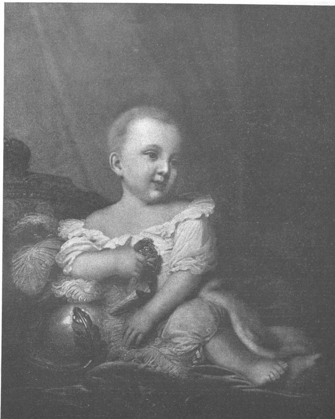
Его Императорское Высочество Великій Князь НИКОЛАЙ ПАВЛОВИЧЪ.