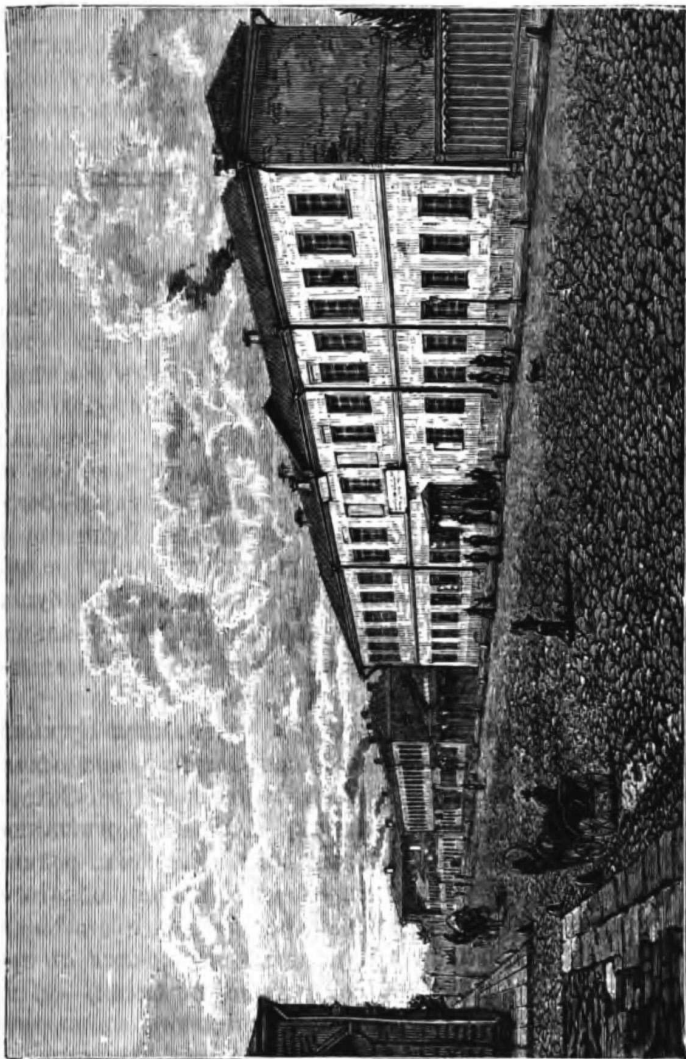
Москва — Фасадъ дома на Нѣмецкой ул., въ которомъ родился А. С. Пушкинъ.