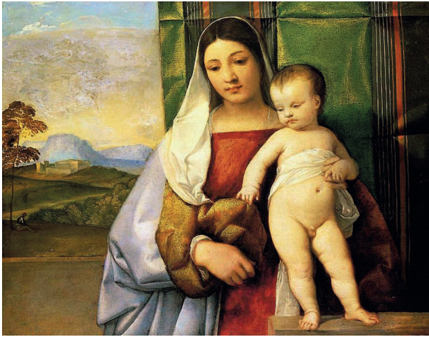
«Мадонна с Младенцем» («Цыганская Мадонна»), около 1512, холст, масло. Художественно-исторический музей, Вена

да Кастельфранко), еще одним величайшим мастером Высокого Возрождения. Первыми работами Тициана, которые были созданы совместно с Джорджоне, были фрески в Немецком подворье, от которых до наших