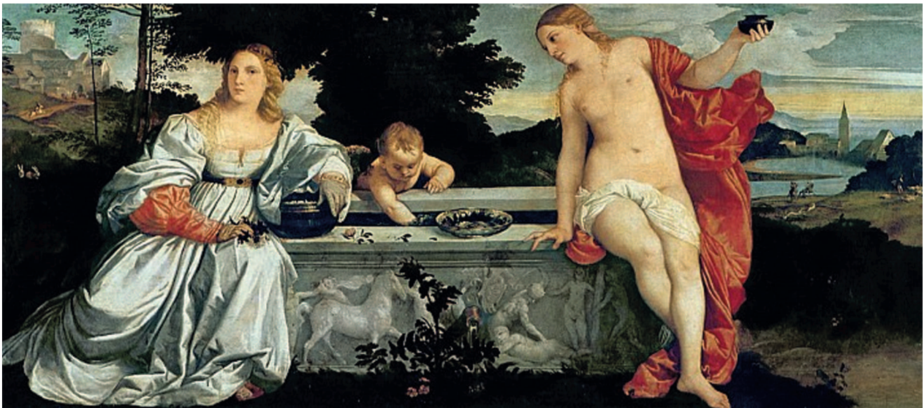
«Любовь земная и любовь небесная», около 1514, холст, масло. Галерея Боргезе, Рим

Тициан сформировался как художник достаточно быстро. К ранним его работам относятся «Портрет Джероламо Барбариго» и «Мадонна с Младенцем и святыми Антонием Падуанским и Роком» (около 1511). Эти святые, как полагали современники Тициана, защищали от чумы, свирепствовавшей в то время в Венеции и унесшей жизнь лучшего друга Тициана, Джорджоне, в 1510 году. Так как оба юных художника работали практически в одном стиле, Тициан закончил картины Джорджоне, оставшиеся после его безвременной смерти незавершенными. В 1511 году Тициан отправился на несколько месяцев в Падую, где создал фрески, посвященные чудесам святого Антония Падуанского.