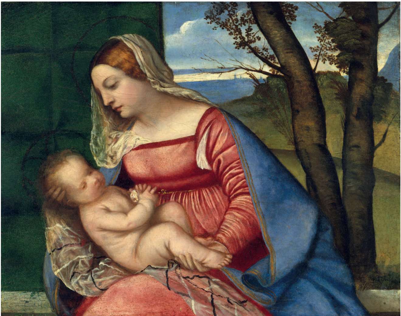
«Мадонна с Младенцем», 1510, холст, масло. Метрополитен-музей, Нью-Йорк

Но это утверждение, скорее всего, имеет мало общего с действительностью. Многие современники живописца указывали на период с 1473-го по 1482-й год. В последнее время специалисты склонны считать годом рождения художника 1490 год. А вот ученые, работающие в Метрополитен-музее и Исследовательском институте Гетти, придерживаются иной версии — они полагают, что Тициан появился на свет в 1488 году.