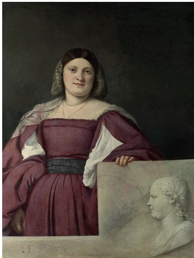
«Портрет славянки», 1508–1510, холст, масло. Лондонская Национальная галерея, Лондон

И в этом нет ничего удивительного, ведь, когда художнику еще не было тридцати, его единогласно признали лучшим живописцем Венеции.