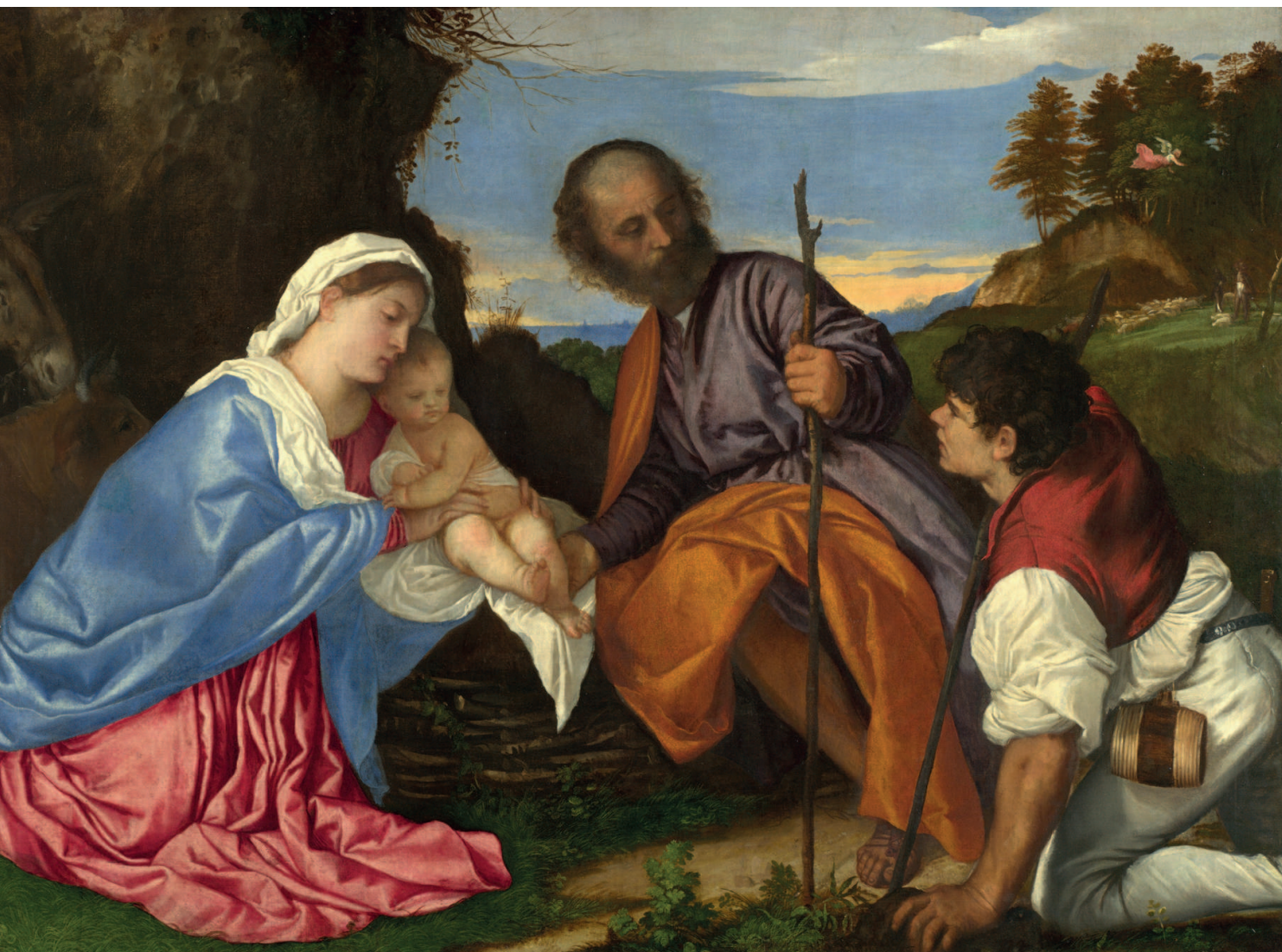
«Святое семейство с пастырем», 1510, холст, масло. Лондонская Национальная галерея, Лондон

начал учиться и работать в мастерской Себастьяно Цуккато, откуда потом перешел в мастерскую Джентиле Беллини, а затем к Джованни Беллини. Во время обучения Тициан познакомился со многими видными представителями венецианской живописной школы. Но самые тесные отношения у него сложились с Джорджоне (Джорджо Барбарелли