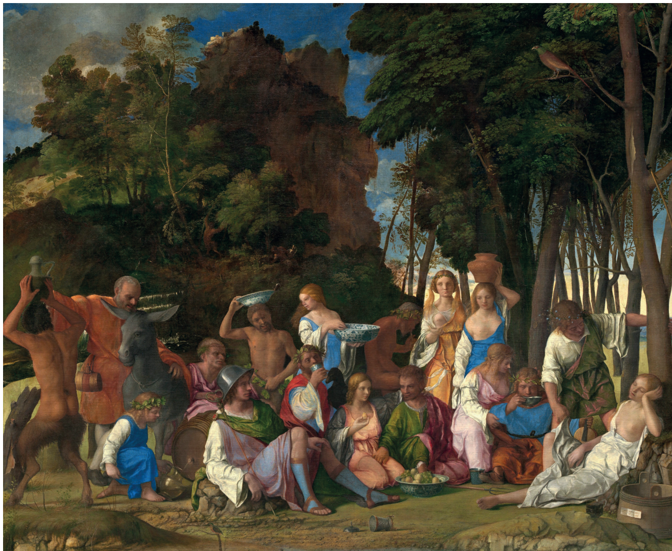
«Пир богов», 1514–1529, холст, масло. Национальная галерея искусств, Вашингтон