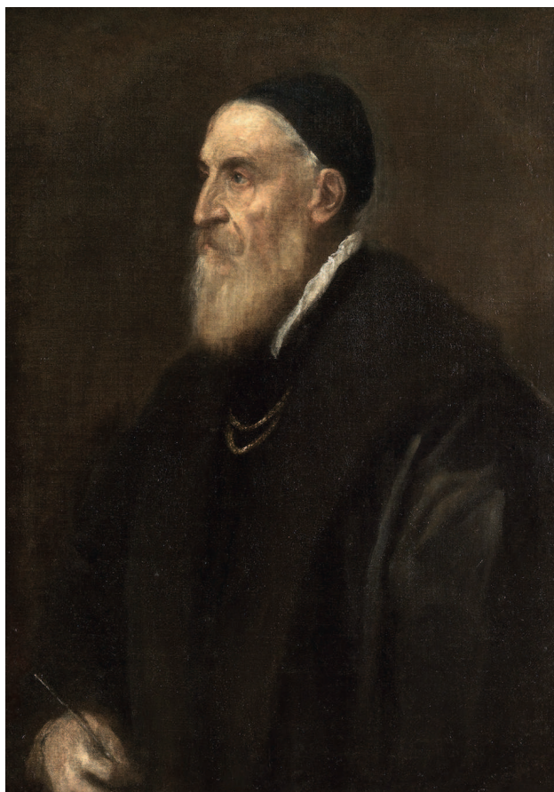
«Автопортрет», около 1567, холст, масло. Национальный музей Прадо, Мадрид

Тициана, которого современники называли королем живописцев и живописцем королей, смело можно поставить в один ряд с такими титанами Возрождения, как Микеланджело, Леонардо да Винчи и Рафаэль. Будучи настоящим мастером своего дела и поистине разносторонним человеком, Тициан, всеми признанный автор картин на библейские и мифологические сюжеты, прославился еще и как блестящий портретист. А его открытия в области живописи и по сей день считаются бесценными. Среди заказчиков художника были короли и римские папы, кардиналы и герцоги.