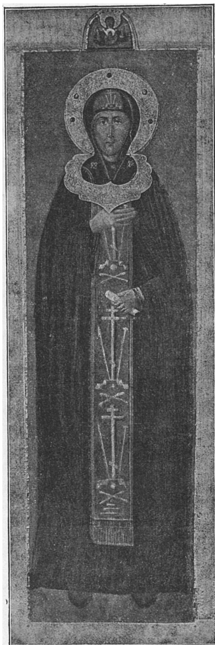
Благовѣрная Княгиня Софія.