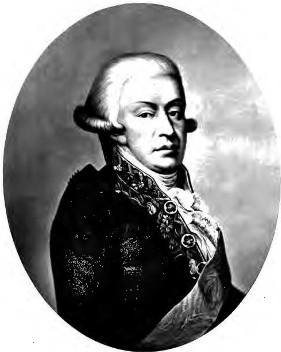
Фото Гравюра Шерера Набоглицъ и К о въ Москвѣ.