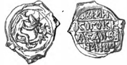
5. Пуль (мѣд.) Ивана Ивановича Тверскаго (1485—9с).

Садкѣ богатомъ гостѣ (Садко Сытиничъ упоминается въ лѣтописи подъ 1167 г., когда заложилъ церковь Бориса и Глѣба), Ставрѣ Годиновичѣ, Кіевскомъ заложникѣ. Лѣтопись подъ 1118 годомъ сообщаетъ: «приведе Володимиръ съ Мстиславомъ вся бояры Новгородскыя Кыеву и заводи я къ честиному хресту, и пусти я домовъ, а иныя у себе остави; и разгнѣвася на ты, оже то грабиша Даньслава и Ноздрѣчу, на сочскаго на Ставра и затоци я вся». Тяжело было жить и по условіямъ мѣста: при полномъ бездорожьи, внутри запертыхъ границъ и подъ страхомъ нашествій, Новгородская область бѣдствовала, въ случаяхъ частаго недорода, отъ страшныхъ голодоловокъ. Такова была голодовка 1128 года: «ядяху люди листъ липовъ, кору березову, инии молицъ истгѣлкше мятуце съ пельми и съ соломоу; инии ушь, мохъ, конину; и тако другимъ падъшимъ отъ глада, трупие по улицямъ и по тѣргу».... «отецъ и мати чадо свое всѣсажаше въ лодю, даромъ гостымъ, ово ихъ измѣроша, а друзии разидошася по чужимъ землямъ. И тако по грѣхомъ нашимъ погиге земля наша».