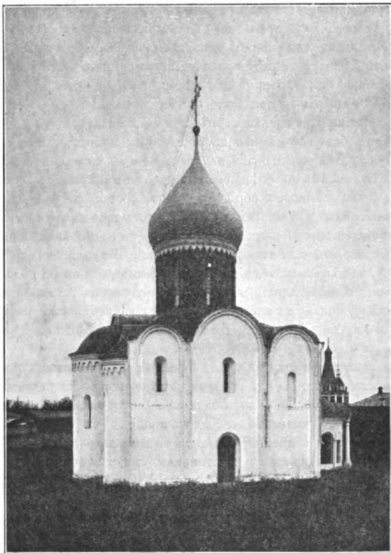
32. Преображенскій соборъ г. Переяславля Залѣскаго, 1152 г.

Простѣйшая постройка этого рода является и первой по времени: это — церковь Переяславля Залѣскаго во имя Спаса (рис. 32), построенной между 1152 и 1157 годовъ: здѣсь порталы безъ колоннъ, выполнены уступами; зубчатые карнизы устроены только на трибунѣ или барабанѣ и на алтарныхъ выступахъ. Но именно простота всѣхъ украшеній, благородство пропорцій придаютъ этой