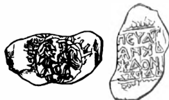
11. Денга Андрея Дим. Можайскаго (1389—1432).

Еще больше принижает нашу древность тот взгляд, который отрицает у русского народа самое существование художественных интересов: будто бы, в то время, как на западе уже в XII и XIII вѣках строили готические храмы, соединяя религиозное чувство с художественным одушевлением и техническими знаниями, у нас «пробавлялись, главным образом, иностранными мастерами». Так, строителями (однако, не обыкновенными) лучших храмов XII вѣка бывали у нас иностранцы, и летописец считает «чуждом», что в Ростове нашлись свои мастера. Замечание, основанное на единичном факте вызова иностранцев во Владимир, представляется крайним и тенденциозным обобщением: Русь была и в древности обширною страной, и устраивалась на жительство в разное время, по разному. Когда Киевская и Черниговская Русь строила каменные храмы своими силами, Суздальская область, едва только колонизованная, должна была, при Андрее Боголюбском, прибегать к вызову мастеров с далекого запада, от немцев, но уже Ростов-